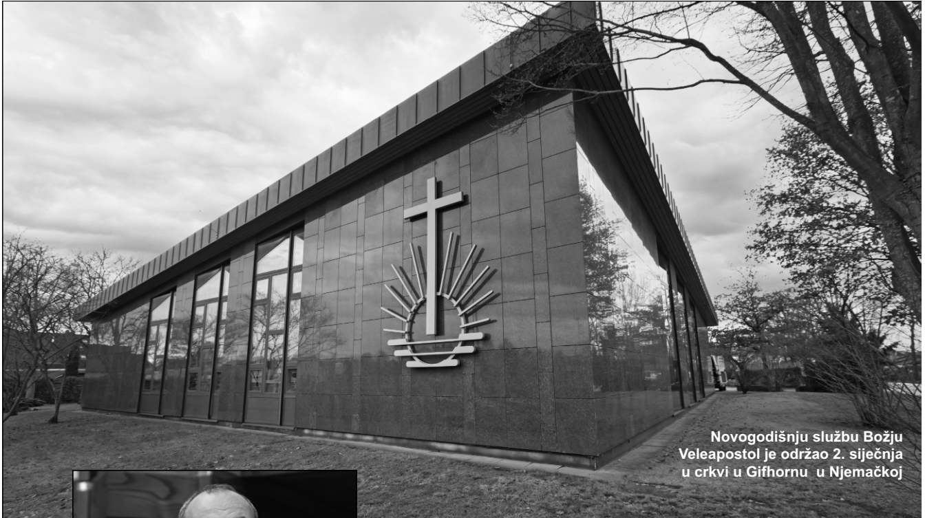
Novogodišnju službu Božju Veleapostol je održao 2. siječnja u crkvi u Gifhornu u Njemačkoj