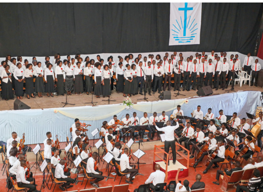
Se ocupó del marco musical la orquesta de Angola Este de la provincia de Moxico