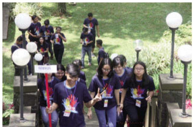
Sebuah kelompok sedang berjalan menuju pos permainan

Sebanyak 250 kaum muda berkumpul di Wisma Shalom, Lembang, Bandung pada Sabtu, 29 Oktober 2016 untuk mengikuti Hari Kaum Muda (HKM) dua Distrik DKI Timur dan Jawa Barat. Ketika mendaftarkan diri, mereka mendapatkan kartu nama yang mencantumkan nama-nama mereka. Tapi ada yang unik di situ, yakni sebuah kode QR. Peserta harus memindai kode QR tersebut dengan piranti lunak ponsel pintar mereka agar terdaftar resmi sebagai peserta HKM.