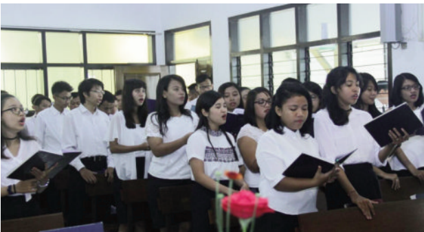
Persembahan pujian dalam kebaktian kaum muda