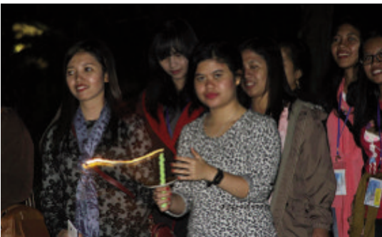
Acara renungan sambil membawa lilin