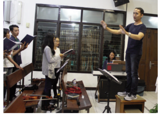
Kiri dan atas: Latihan angklung massal dan paduan suara bersama