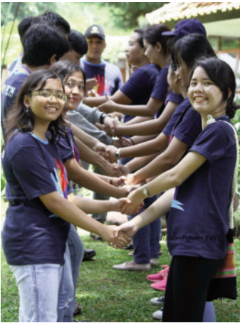
Kiri atas: “Jangan lepaskan tanganmu” Kanan atas: Permainan yang membahas tentang Yohanes Surya