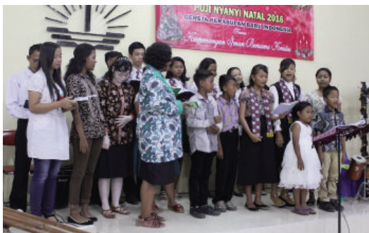
Penampilan anak-anak sekolah minggu dan kaum muda (Pantura Barat)

Banyak cara yang bisa dilakukan untuk memperingati kelahiran Yesus Kristus. Di antaranya melalui nyanyian pujian sambil membawa kesaksian kepada lingkungan dan acara yang menyenangkan. Pada tahun 2016 ini, sidang jemaat-sidang jemaat di Subdistrik Pantura Barat dan Klampok melaporkan kegiatan-kegiatannya.