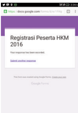
Registrasi para peserta dilakukan dengan menggunakan teknologi gawai

Kaum muda sangat akrab dengan gawai ( gadget ). Berfoto, mencari informasi, memesan kendaraan dan chatting adalah sekian dari banyaknya aktivitas yang dilakukan dengan gawai. Bahkan lebih dari itu: Mengikuti acara Hari Kaum Muda!