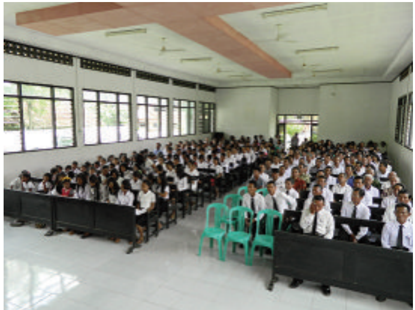
Atas: Suasana kebaktian di sidang jemaat Mojokerto

Di Lampung Timur, Rasul melayani saudara-saudari yang sudah berkumpul di sidang jemaat Sumberagung dan dilanjutkan ke Lampung Tengah di sidang jemaat Mojokerto, Sripurnomo, Kalirejo, Sinarsari, Sidomulyo, Pangungrejo dan Sidomukti. Para pemangku jawatan juga mengalami kebaktian khusus pada Jumat, 28 Oktober 2016 di sidang jemaat Sukosari. Hari terakhir pelayanan Rasul, yakni Minggu, 30 Oktober 2016 diisi dengan pelayanan kebaktian kaum mu-