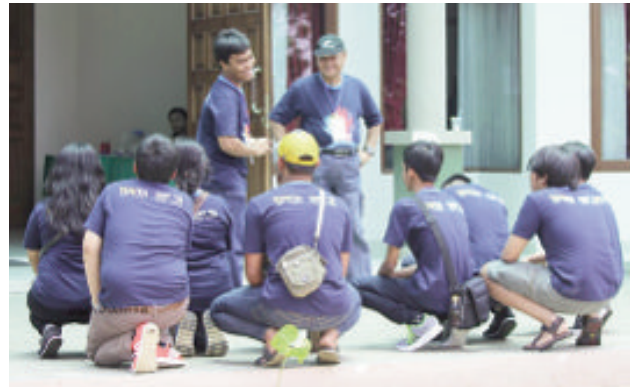
Setiap grup mempresentasikan tokoh cerita seperti yang digambarkan Yohanes Surya