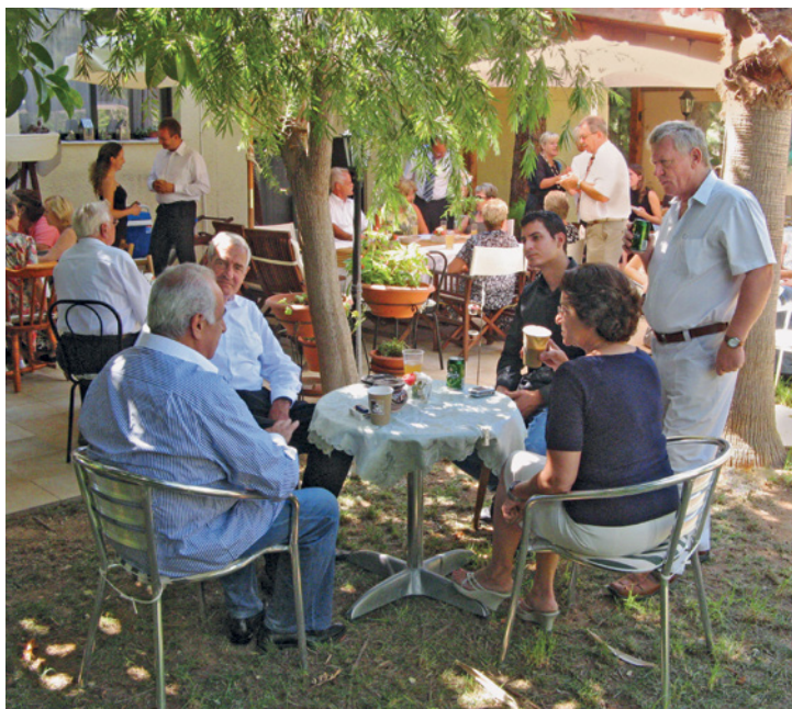
Anggota-anggota menghabiskan waktu bersama setelah sebuah kebaktian di Limassil (Siprus)

dari anggota-anggota kita – adalah bahwa pertolongan Allah juga sering berperan pada tingkatan emosi. Sebagai contoh, ada sebuah perang pada tahun 2006. Mengerikan ketika pesawat-pesawat menjatuhkan bom-bom. Seorang saudari berkata kepada saya, “Sungguh-sungguh menyeramkan, tetapi meskipun demikian saya memiliki semacam kedamaian batin.” Ia yakin bahwa kedamaian batin itu dapat dilacak pada banyak doa yang dipanjatkan mewakili anggota-anggota kita di negara ini.