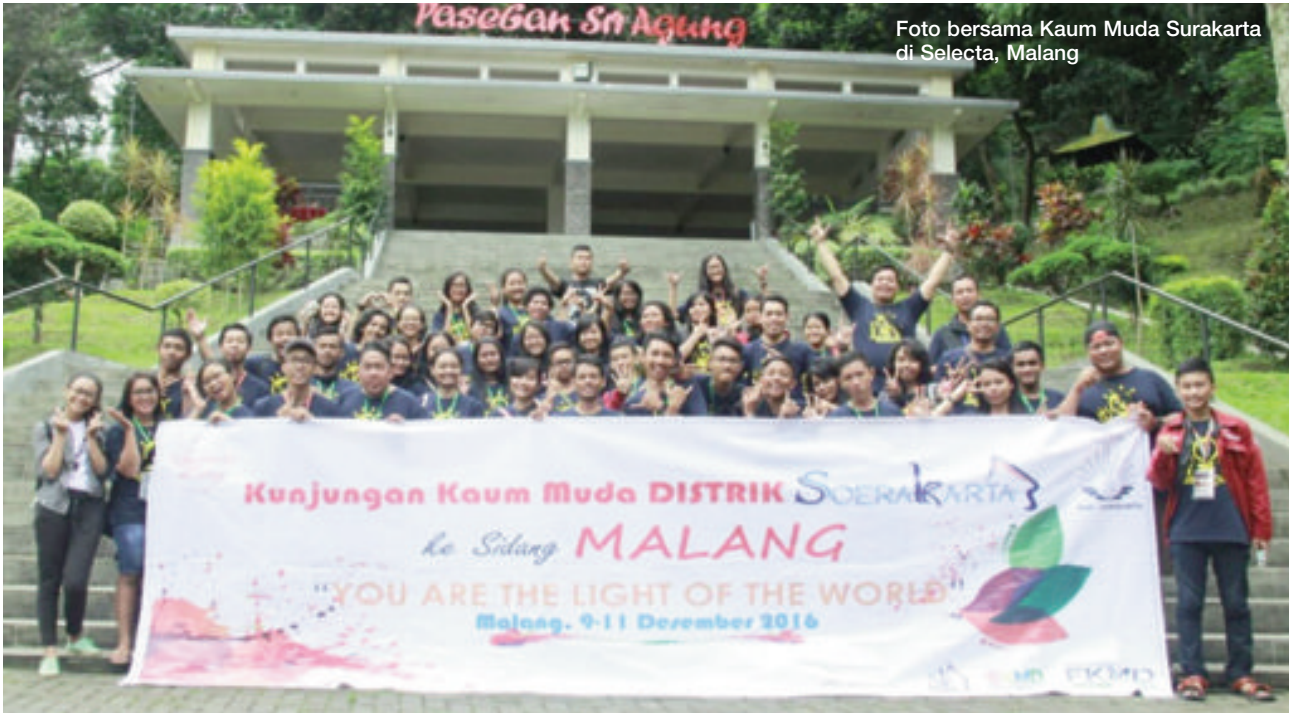
Foto bersama Kaum Muda Surakarta di Selecta, Malang