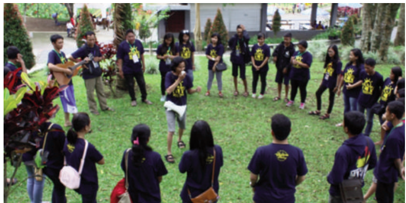
Permainan bertema rohani di tempat wisata air terjun Coban Rondo dan Taman Rekreasi Selecta