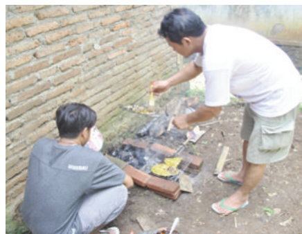
Atas: Sukacita mereka dengan hasil tangkapan ikannya

Sidang jemaat Klampok mengadakan kegiatan memancing untuk menyemarakkan suasana Natal pada 24 Desember 2016. Setelah dibuka dengan doa oleh Evangelist Distrik Sukmo Hadi Prayitno, kegiatan memancing yang melatih kesabaran diri itu pun dimulai dan diikuti baik oleh anak-anak maupun dewasa, laki-laki dan perempuan. Suasana makin meriah ketika para peserta berusaha menangkap ikan tanpa alat, istilah dalam bahasa daerah Klampoknya adalah nggogoh iwak . Setelah ditangkap, semua ikan dimasak dan dinikmati para peserta. mp/klmpk