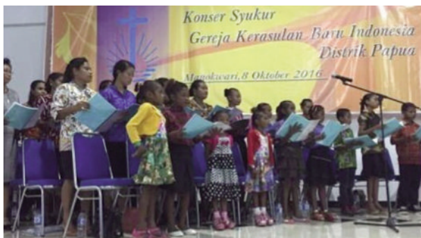
Kiri bawah: Persembahan pujian pada Konser Syukur Distrik Papua