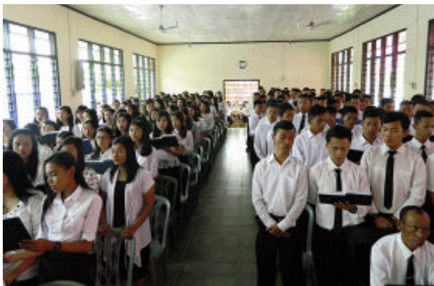
Kebaktian kaum muda se-Distrik Lampung di sidang jemaat Tanjungjaya