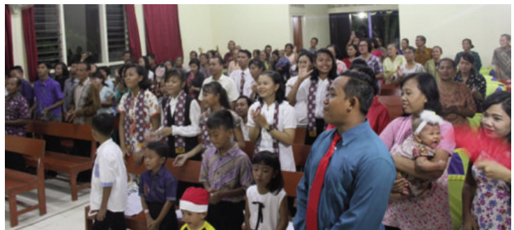
Saudara-saudari dan tamu undangan yang menghadiri perayaan Natal Subdistrik Pantura Barat