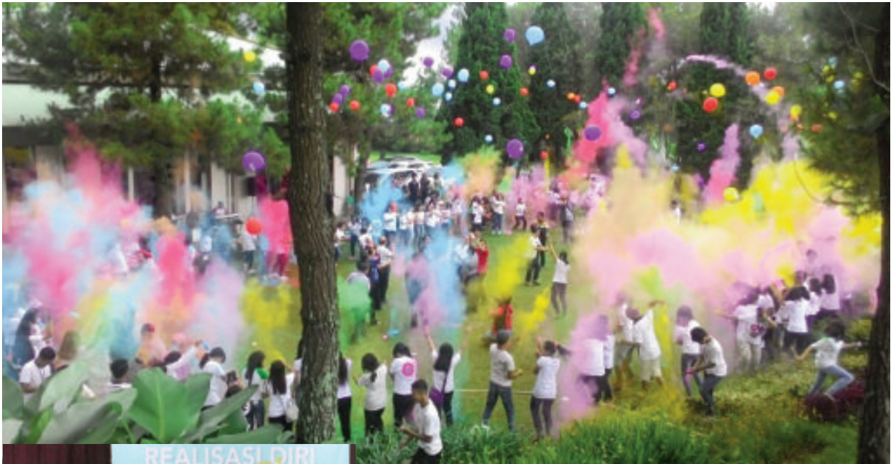
"Colourfare" menghiasi acara penutupan Hari Kaum Muda