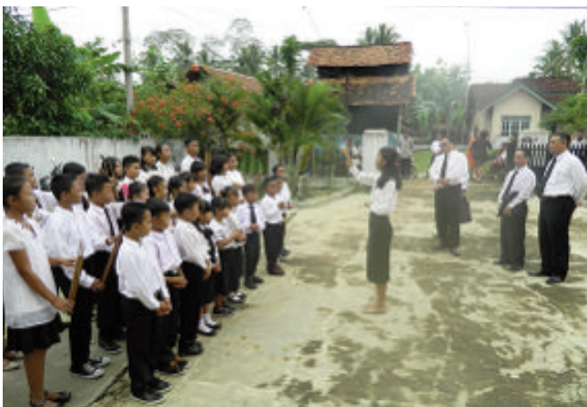
Kiri: Anak-anak sekolah minggu dan sekolah agama menyambut kedatangan Rasul dan rombongan dengan persembahan nyanyian diiringi musik angklung