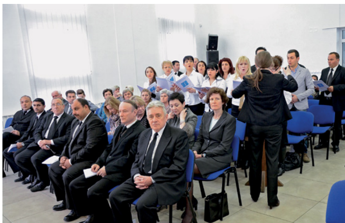
Desde 1958 hay cristianos nuevoapostólicos viviendo en Macedonia. Hoy residen 400 hermanos en la fe en el país ubicado al sur de Europa.