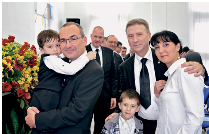
Después de 2003 y 2009, tiene lugar la tercera visita de un Apóstol Mayor. El Apóstol Mayor Schneider recibió una cordial bienvenida.