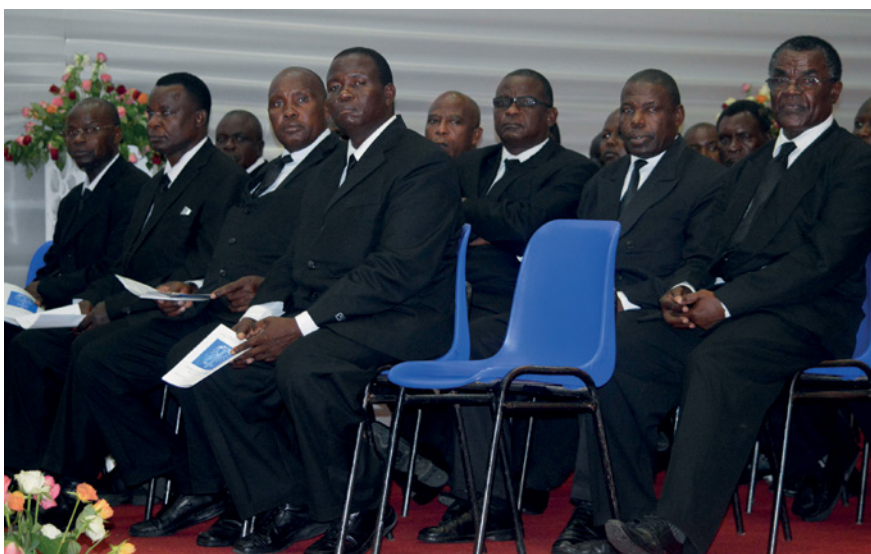
Apóstoles y Obispos en el altar

Amados hermanos y hermanas, debemos creer en el Hijo de Dios. Debéis creer en nuestro Redentor y también creer que Él ha dado su vida por nosotros. Él es la prueba de su amor hacia nosotros. No podemos ir cada mañana a Dios y decirle: “Oh, Dios, por qué no nos das una señal para que reconozcamos lo grande que es tu amor hacia nosotros”. Esto no funciona. Hace rato que Jesús dio pruebas de su amor por nosotros: Él murió por nosotros.