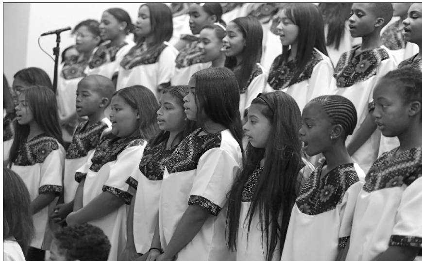
Zbor, dječji zbor i orkestar oduševili su publiku izvedbom „Spirit-renewed!“ Johna Rodriquesa iz glazbene sekcije mjesne Crkve

Ako vjeruješ, možeš. Ne boj se! Nikada nije uzaludan posao koji je obavljen na poticaj Duha Svetoga. Dozvoljavam si još jednom ponoviti! Nikada nije uzaludan posao koji je obavljen na poticaj Duha Svetoga. Nemojte se bojati! Duh je snaga i on je onaj koji u vama prebiva.