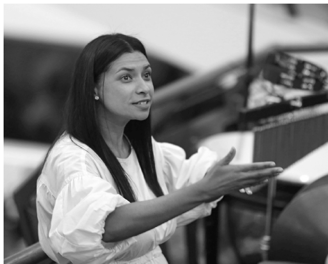
Zbor i dječji zbor obogatili su službu Božju raznim glazbenim priložima

Duh Sveti je Duh snage. Duh Sveti se prikazuje i kao snaga Božja. A ta je snaga Božje djelovanje, to su djela Božja. Po Duhu Svetom Bog iskazuje svoju vlast i moć, svoju snagu. Nastojmo uvijek imati na umu da Crkva nije ljudsko djelo! Crkva je djelo Duha Svetoga. Kada bi Crkva bila ljudsko djelo, danas je više ne bi bilo. Poznamo ljude i znamo za što su prije svega sposobni i za što nisu sposobni. Crkva danas ne bi više postojala, kada bi bila ljudsko djelo. Ali ona je djelo Duha Svetoga, Duh Sveti je snaga Božja. Ništa ne može spriječiti Duha Svetoga u vršenju njegovog naloga. Crkva će pobijediti smrt. Nitko ne može spriječiti Duha Svetoga u vršenju njegovog naloga u Crkvi.