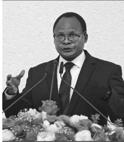
Okružni apostol Kububa Soko (Zambija, Malavi, Zimbabve)