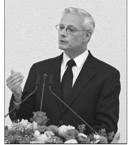
Pomoćnik okružnog apostola John W. Fendt (SAD)

radost! Tu zahvalnost izričem u ime svih apostola. Ponavljam još jednom, mi govorimo zajedno s apostolom Pavlom: Zahvaljujemo Bogu za radost koju osjećamo zbog vas! Vi ste naša radost! Morao smo to jednostavno reći.