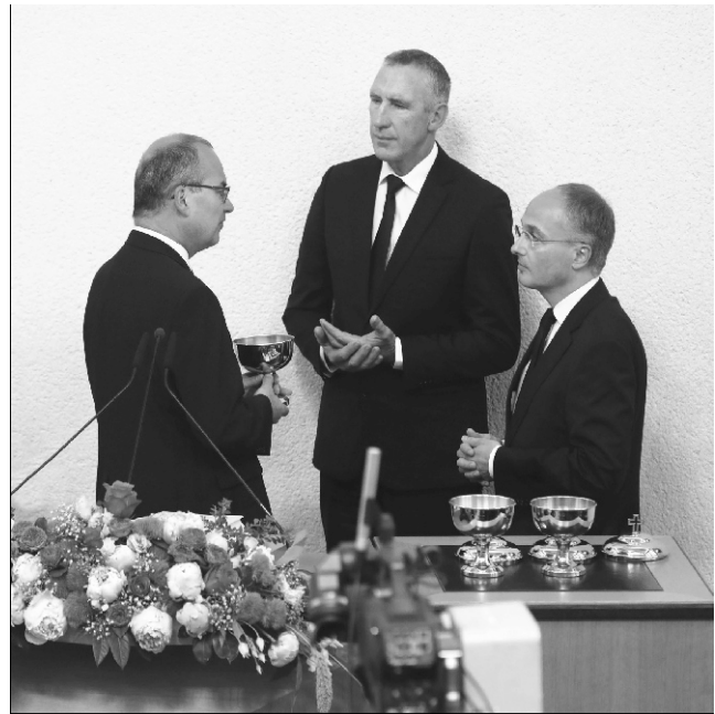
Okružni apostol Rüdiger Krause (Sjeverna i Istočna Njemačka) otkriva kaleže za slavljanje Svete večere

Svetoga. I u tim, po broju članova, malim zajednicama Duh Sveti razvija puninu svoje snage tako da svi vjernici mogu jednako doživjeti prisutnost Božju! Mogu primiti puninu spasenja. Duh Sveti se ne vezuje uz određeni broj vjernika. On i u maloj zajednici djeluje svom snagom pa i kada su okolnosti naizgled nemoguće. Mislim na mnoge zajednice gdje se braća i sestre okupljaju u izbjegličkim kampovima. Drugi se moraju skrivati i okupljaju su na nekom skrovitom mjestu. Nemaju ništa, ali ipak snagom Duha Svetoga primaju puninu spasenja. U zemljama u kojima imamo mnogo vjernika, imamo čak i zajednica koje djeluju i u zatvorima. Tamošnji su novoapostolski kršćani osuđeni i zatočeni, tako da su prisiljeni slaviti službu Božju u zatvoru. Društvo im je poručilo da ih ne želi i da se moraju udaljiti. Ali tamo gdje se slavi služba Božja, Duh Sveti može djelovati svom snagom. I ta braća i sestre, ti vjernici u takvom posebnom okruženju doživljavaju Božju prisutnost, doživljavaju ljubav Božju i primaju sve što im je potrebno za spasenje. Imamo posve konkretnih primjera. Zahvaljujemo