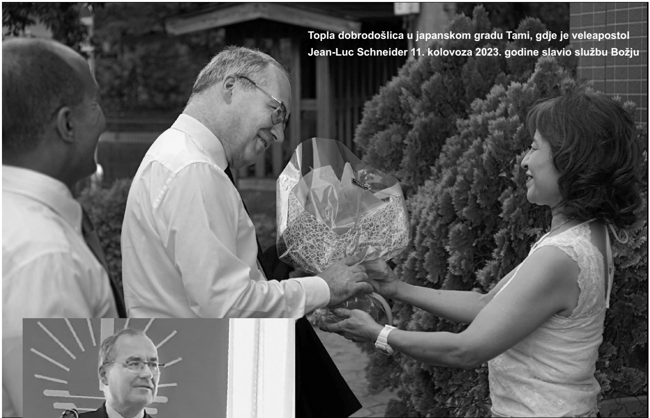
Topla dobrodošlica u japanskom gradu Tami, gdje je veleapostol Jean-Luc Schneider 11. kolovoza 2023. godine slavio službu Božju