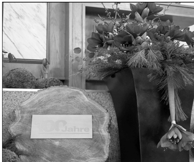
Zajednica se oduševljeno i dugo vremena radosno pripremala na posjet Veleapostola

Da bi ostali vjerni, vjernici su se uvijek morali truditi i odricati. Ali ako su naši preci ustrajali i ostali vjerni, i ako unatoč mnogim poteškoćama nisu odustali, zašto bismo mi danas mislili da nećemo uspjeti ostati vjerni Bogu? Nema razloga da odustanemo! Nastojmo jednostavno slijediti Gospodina! Što je činio kroz proteklih stotinu godina, učinit će i za nas danas i u budućnosti. Uvijek će nam dati snage da ostanemo vjerni do kraja. Prestanimo s