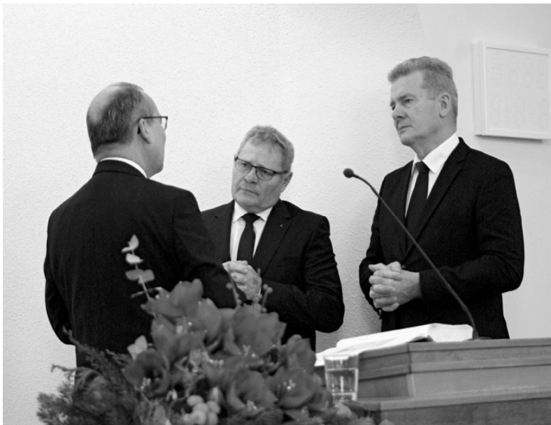
Ganutljiva je bila Sveta večera za pokojne

Naravno da smo kao ljudi izloženi kušnjama. U našem Katekizmu stoji zapisano da nitko nije slučajno izložen kušnji. Ponekad imamo dojam da drugačije ne može ni biti. Bujica ljudi nas nosi sa sobom. Ne, nismo prisiljeni činiti sve što nam se predlaže, činiti sve što i drugi čine. Ne moramo sve prihvaćati. Grijeh vreba pred tvojim vratima, ali ti možeš vladati nad njime. Uz Kristovu pomoć možeš grijehu reći 'ne'. Možeš reći: „Ne, to neću učiniti, bez obzira kakve bile posljedice, to je grijeh i protivi se volji Božjoj.“ Nastojmo vladati svojim životom! Kontrolirajmo njega i sami sebe! Ima ih doduše koji govore da su ljudi postali marionete, da netko drugi za njih vuče konce i da se s njima može raditi što god netko poželi. Ali ne i sa mnom! Sotona ne može sa mnom raditi što želi. Uz Kristovu pomoć mogu vladati svojim životom i svojom naravi.