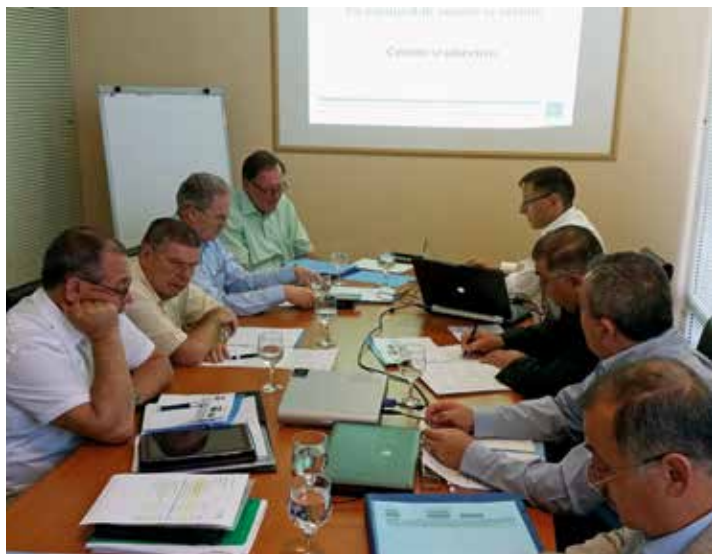
Les apôtres et évêques en réunion à Timișoara