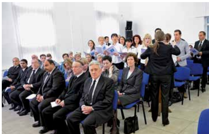
Les chrétiens néo-apostoliques vivent en Macédoine depuis 1958. Aujourd'hui, 400 frères et sœurs vivent dans ce pays d'Europe du Sud.