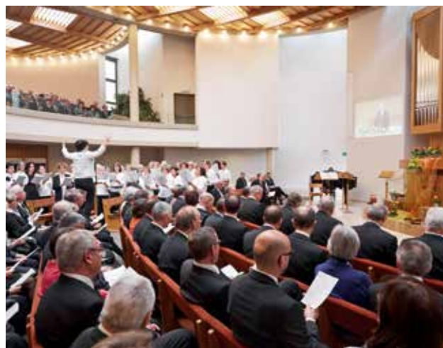
Le service divin pour les chefs de communauté et leurs épouses a lieu dans l'église d'Ostermundigen