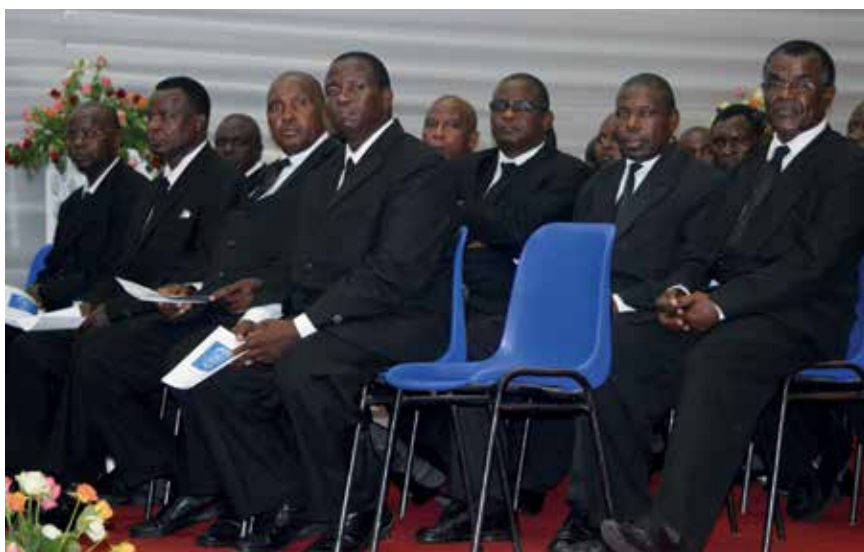
Les apôtres et les évêques à droite de l'autel

Pour le Seigneur, la vie éternelle sera toujours plus importante que toutes les choses terrestres. Il ne fait donc aucun sens de lui demander de changer les priorités.