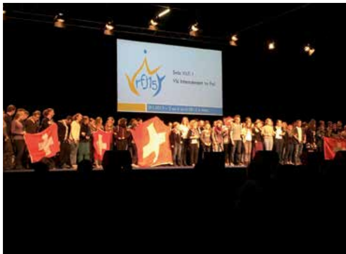
Les jeunes de Suisse se présentent