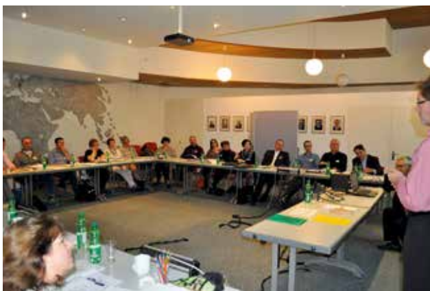
Les participants au colloque durant une présentation

Une fois par an, les responsables de district de chaque degré d'enseignement se rencontrent pour un colloque. Le 21 mars 2015, les trois groupes de l'école préparatoire du dimanche, du cours de religion et du réseau de relations se sont réunis en parallèle. Le point central dont a discuté le groupe de l'école préparatoire du dimanche était l'intégration des enfants de ce degré dans la communauté. Le groupe du cours de religion a traité le thème « Comment apprenons-nous ? ». Encourager, soutenir et cultiver le réseau de relations des enfants était la préoccupation du troisième groupe. C'est avec joie que les impulsions suscitées lors de ce colloque ont été reçues par les trois groupes ; elles enrichiront à l'avenir leur travail dans les différents districts.