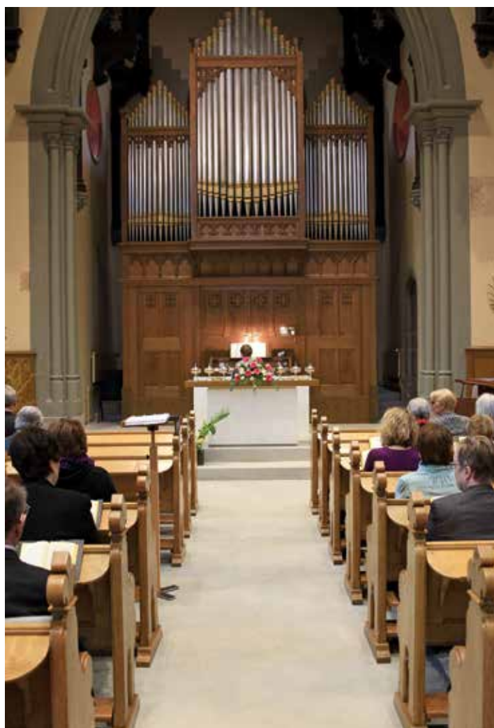
L'orgue de l'église de Montreux