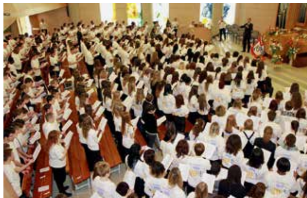
Le grand chœur des jeunes