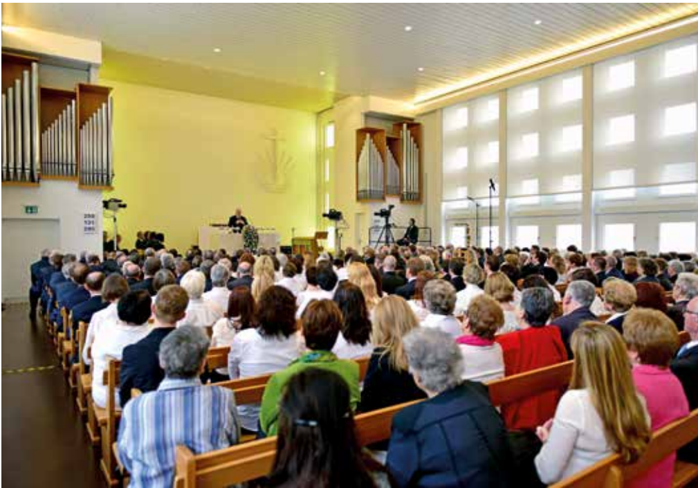
Vue de la salle comble de l'église de Schaffhouse-Neuhausen

La parole servant de base à ce service divin se trouvait en Colossiens 3 : 15 : « Et que la paix de Christ, à laquelle vous avez été appelés pour former un seul corps, règne dans vos cœurs. Et soyez reconnaissants. » Dans sa prédication, il a rendu la communauté attentive à l'importance de la paix de Christ. Que cette paix règne dans les cœurs et détermine nos décisions.