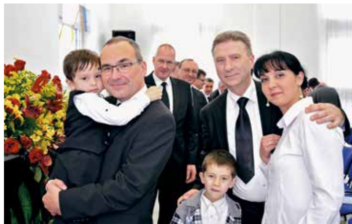
Après 2003 et 2009, c'est la troisième visite d'un apôtre-patriarche. L'apôtre-patriarche Schneider a été chaleureusement accueilli.