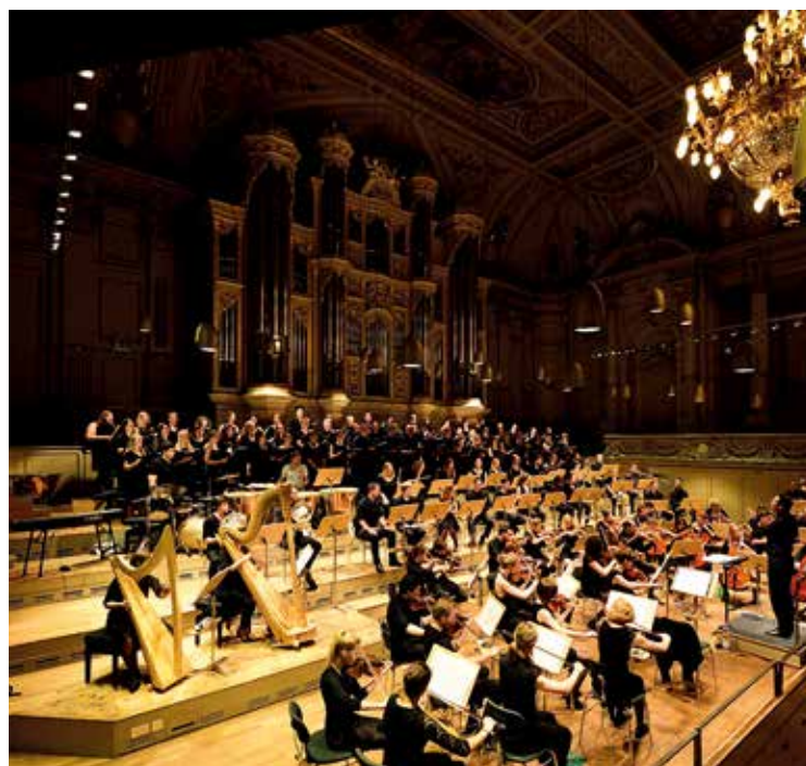
Grand concert de l'Orchestre symphonique des jeunes et du Chœur NABENE à la Tonhalle de Zurich

Éditeur : Jean-Luc Schneider Überlandstrasse 243, CH-8051 Zurich, Suisse Éditions Friedrich Bischoff GmbH Frankfurter Straße 233, 63263 Neu-Isenburg, Allemagne Rédacteur : Peter Johannung, Andreas Grossglauser