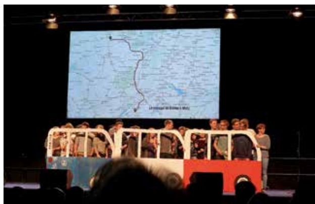
Extrait de la présentation des jeunes de Suisse

À la fin de sa prédication, l'apôtre-patriarche a exhorté les jeunes avec ces mots : « Christ a besoin de notre témoignage. Christ vit ! Nous voulons le montrer à nos concitoyens, leur montrer la nature de Dieu, leur témoigner que Dieu agit aujourd'hui, que l'on peut le rencontrer à l'église, dans la communion fraternelle. »