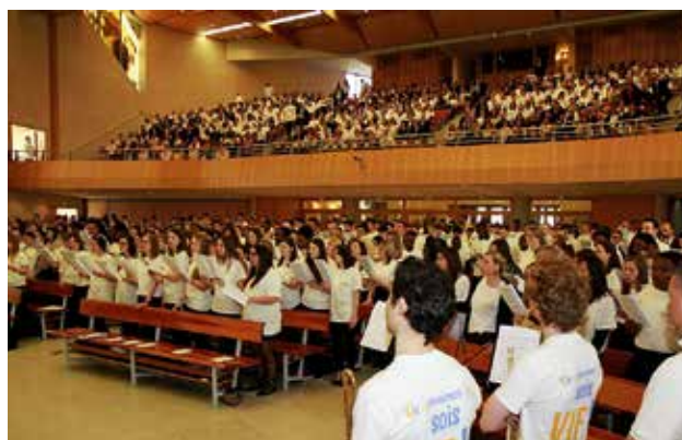
L'église de Metz, occupée jusqu'à la dernière place