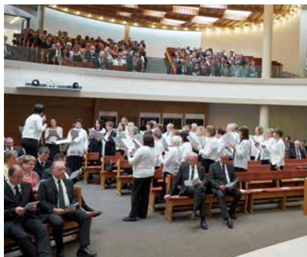
Le chœur de femmes