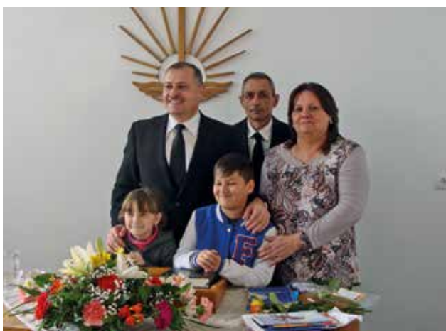
L'apôtre Cone avec le chef de communauté, sa femme (la monitrice du cours de religion) et leurs deux petits-enfants