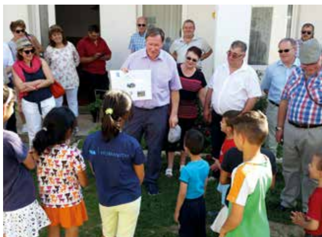
L'apôtre de district et ses accompagnants visitent un home d'enfants à Zabrani