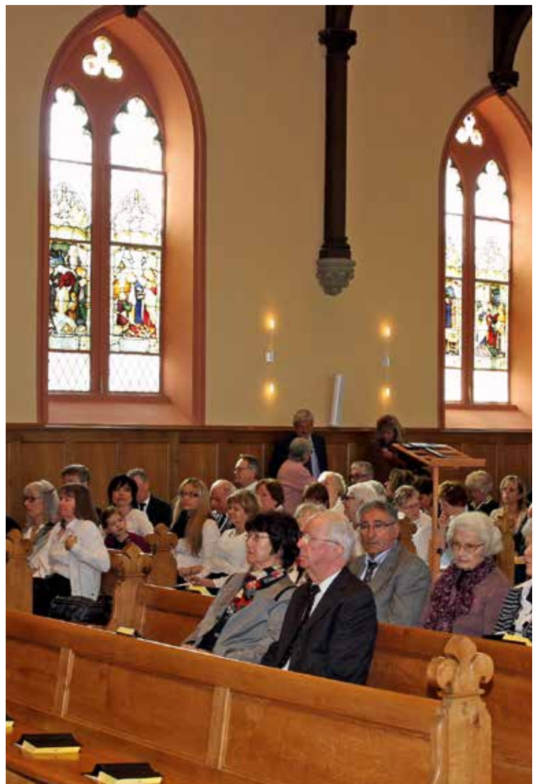
La communauté avant le service divin de réouverture