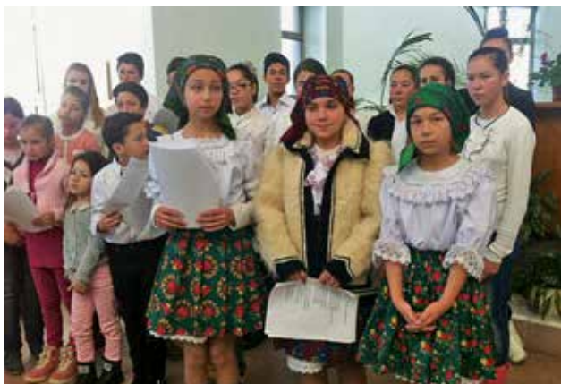
Le chœur d'enfants du district d'Ariniș et Baia Mare ; certains enfants portent un vêtement traditionnel