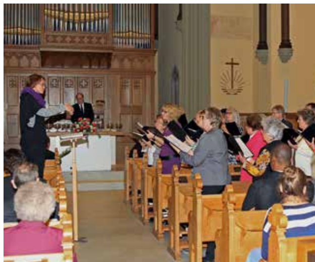
Le chœur de la communauté de Montreux