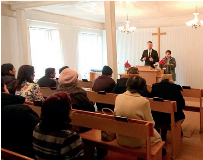
Օձունում անցկացվող ժամերգության ժամանակ