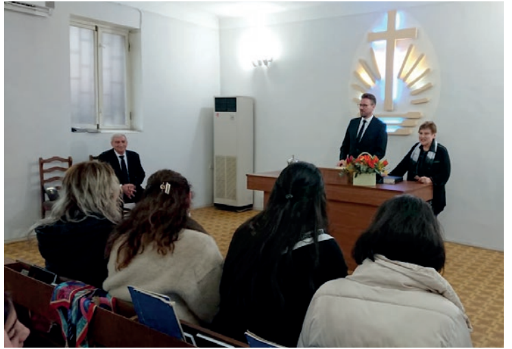
Առաքյալ Ֆոլլմաննը ժամերգություն է տոնում Երևանի համայնքում

առաջարկով զոհասեղանի մոտ ծառայեց համայնքի սարկավագուհիներից մեկը, ում խոսքը դուր եկավ ինչպես առաքյալին, այնպես էլ քույր-եղբայրներին: