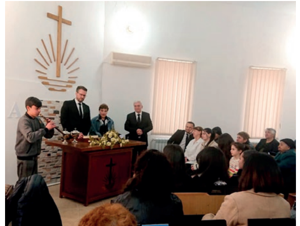
Ժամերգության ավարտին Վանաձորի համայնքից այս տղան նվագում է հայկական դուդուկ