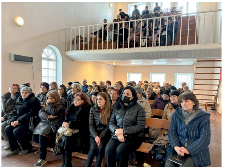
Գյումրիի համայնքում տոնվող ժամերգության ժամանակ գրեթե բոլոր տեղերն զբաղված են

Առաքյալ Ռենե Ֆոլլմաննը լավ տպավորություններով վերադարձավ Գերմանիա: