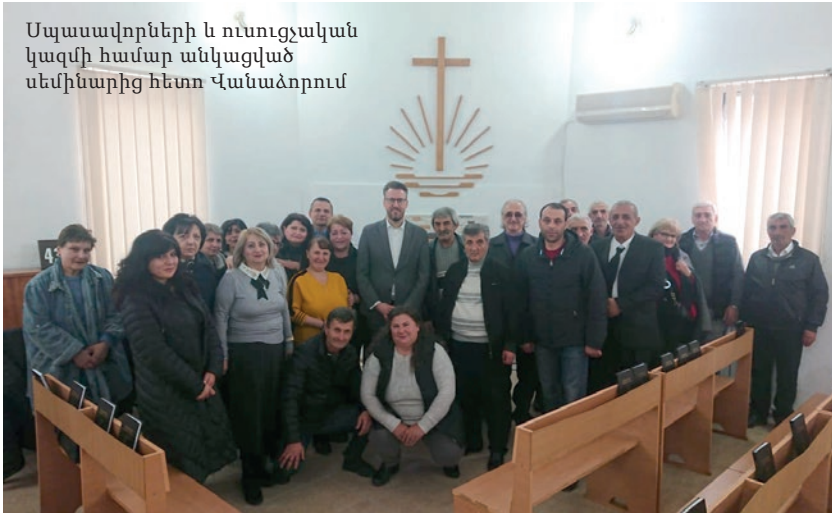
Սպասավորների և ուսուցչական կազմի համար անկացված սեմինարից հետո Վանաձորում