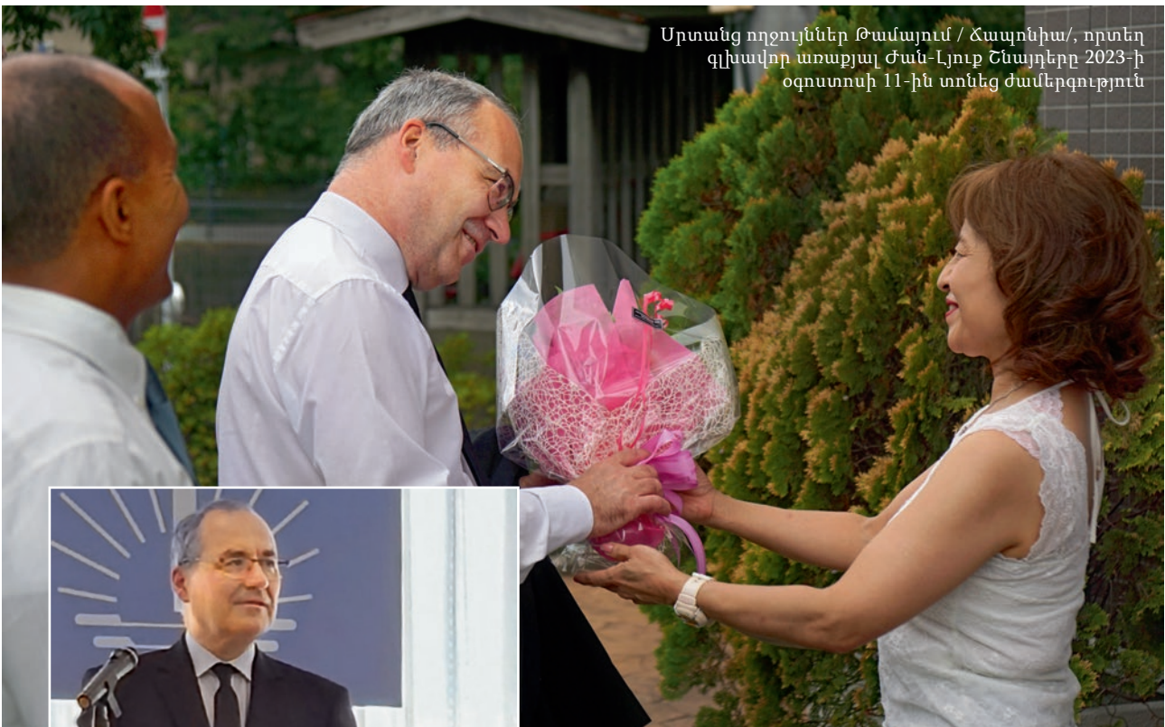
Սրտանց ողջույններ Թամայում / Ճապոնիա/, որտեղ գլխավոր առաքյալ Ժան-Լյուք Շնայդերը 2023-ի օգոստոսի 11-ին տոնեց ժամերգություն