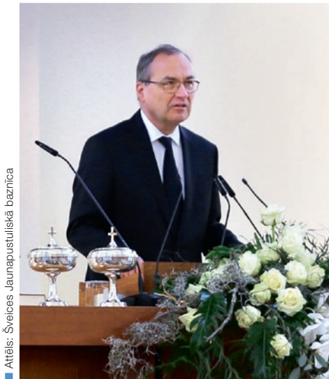
Attēls: Šveices Jaunapustuliskā baznīca