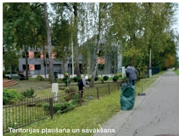
Teritorijas pļaušana un savākšana