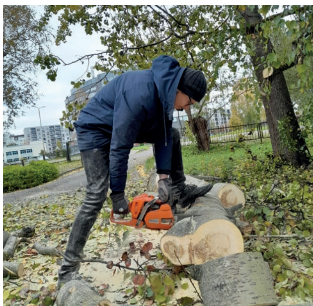
Attēls: Latvijas Jaunapustuliskā baznīca