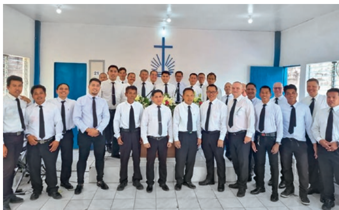
Attēls: Dienvidrietumu Āzijas Jaunapustuliskā baznīca

Plašā jūra atrodas starp Filipīnu salām, kuras apriņķa apustulis Edijs Isnugroho apustuļa Samuela Tansahtikno pavadībā apmeklēja no jūnija beigām līdz jūlija sākumam. Pieci dievkalpojumi un divas tikšanās ar garīdzniekiem notika Leitē, Boholā un Cebu – trīs dažādās salās. Spilgtākais notikums bija dievkalpojums aizgājējiem 2. jūlijā Cebu centrālajā baznīcā.