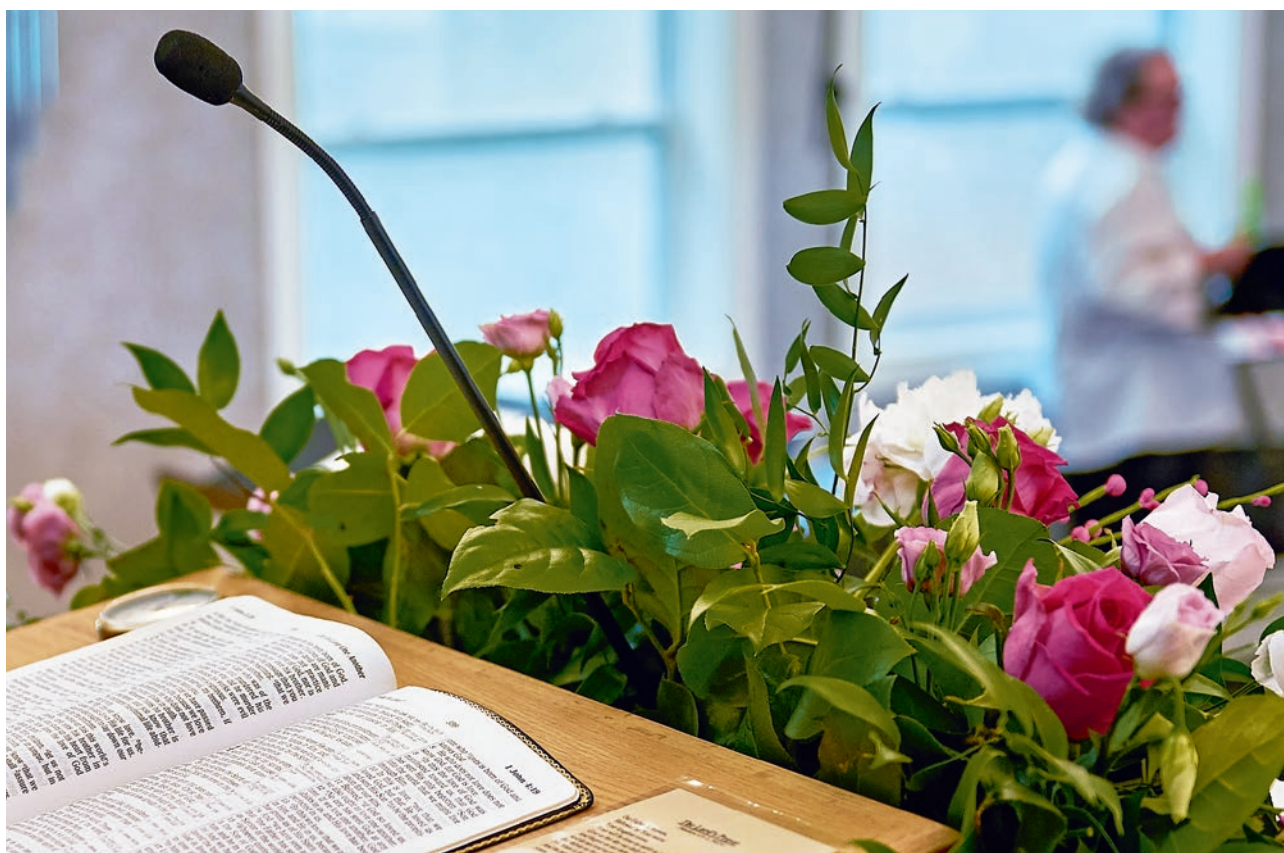
Attēls: Kanādas Jaunapustuliska baznīca