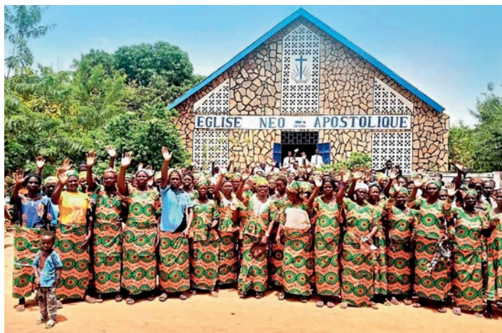
Attēls: Benina un Togo Jaunapustuliskā baznīca