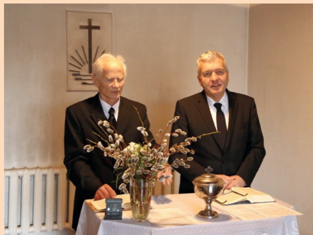
Apustulis Otens Jelgavas draudzē pie altāra