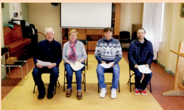
Brāļi un māsas pēc dievkalpojuma ar apustuli