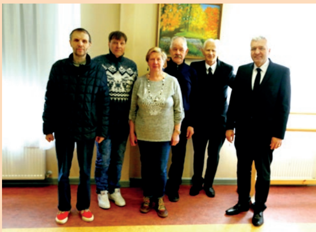
Saldus draudzes brāļi un māsas

Ko mums nozīmē šie vārdi? Mēs kā Dieva bērni arī esam bieži saistīti grēka varā, un katrs grēks mūs attālina no Dieva. Grēks sasaista mūs un neļauj piecelties un tuvoties Dievam. Kad mēs ar dziļu nožēlu par izdarīto tuvojamies Dievam, Viņš piedod mums, un mēs atkal varam būt brīvi no grēka varas, nokrīt grēka pinekļi, un mēs atkal varam piecelties un staigāt.