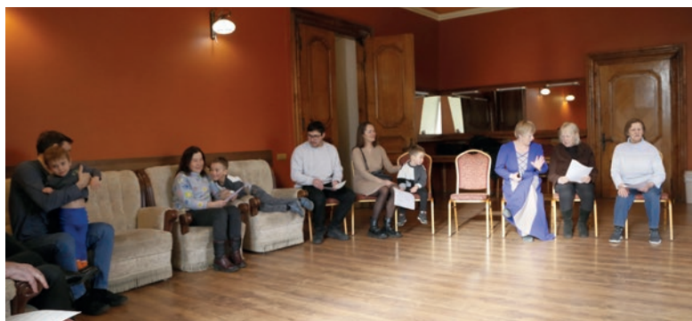
Jaunpils draudzes brāļi un māsas pirms dievkalpojuma

Šajā dievkalpojumā trīs bērni saņēma Svētā Gara sakramentu, kā arī viens no viņiem pirms tam tika kristīts ar ūdeni, saņemot svētās ūdenskristības sakramentu.