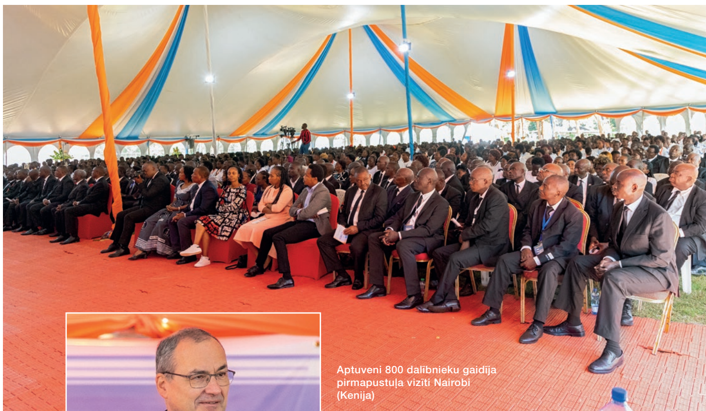
Aptuveni 800 dalībnieku gaidīja pirmapustuļa vizīti Nairobi (Kenija)