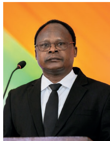
Apriņķa apustulis Kububa Soko

Dievam un nepadodamies. Jo mēs esam pārliecināti, ka Dievs turēs savu solījumu. Nav iemesla pārtraukt kalpot Viņam.