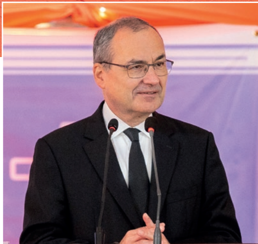
Շուրջ 800 մասնակից սպասում էր գլխավոր առաքյալի այցին՝ Նաիրոբիում / Քենիա/