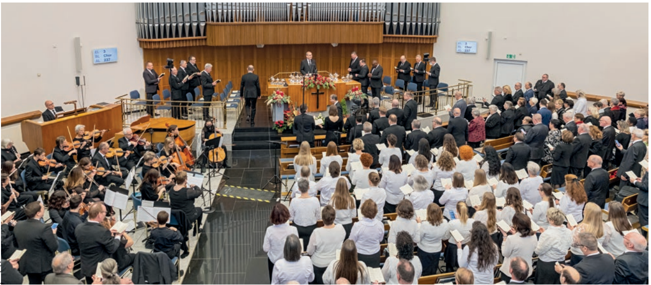
Վերամեծիկի համար շրջանային առաքյալի օգնականի