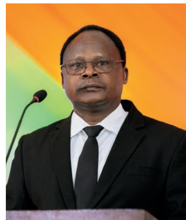
Apostoli i distriktit Kububa Soko

gjithashtu duke i shërbyer vetes me besnikëri dhe drejtësi.