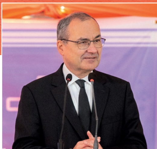
Rreth 800 pjesëmarrës prisnin vizitën e apostulit kryesor në Nairobi (Kenia)