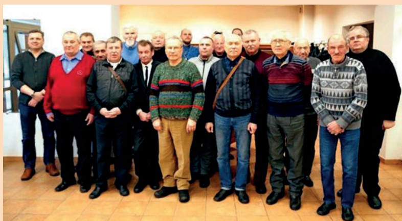
Tarnybos broliai seminare Kaune

Po pamaldų bendruomenė ir svečiai klausėsi koncerto „Tegul muzikos garsai apšviečia širdis Kalėdų dvasia“, kurį, tęsdami ilgametę tradiciją, dovanojo Klaipėdos J. Kačinsko muzikos mokyklos mokinių ir mokytojų kolektyvai bei solistai, dalyvaujantys integruotame edukaciniame projekte „Muzika visiems“.