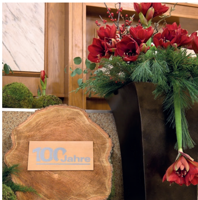
Iš anksto dėjuodamasi vyriausiojo apaštalo vizitu, bendruomenė tam ruošėsi ilgą laiką.

sunkumų nematė priežasties pasiduoti, kodėl mes šiandien turėtume sakyti: „Taip, bet mes negalime.“ Nėra jokios priežasties pasiduoti! Tiesiog toliau sekime Viešpačiu. Tai, ką jis padarė prieš šimtą metų, jis darys už mus ir ateityje. Jis visada suteiks mums jėgų išlikti ištikimiams iki galo. Nustokime amžinai skųstis ir verkšlenti. Tai nėra sunkiau nei buvo mūsų protėviams. Viešpats yra ištikimas. Jis suteiks mums jėgų, reikalingų išlikti ištikimiams iki galo. Ir visi, kurie to tikrai nori, pasieks tikslą.