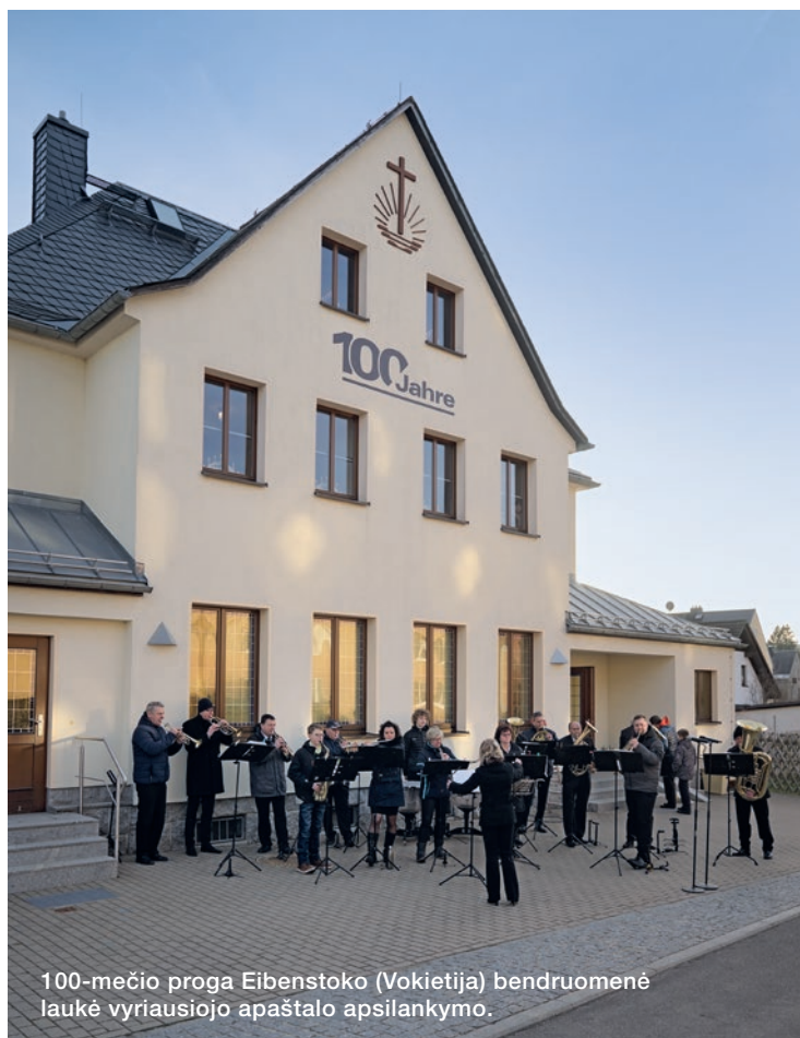
100-mečio proga Eibenstoko (Vokietija) bendruomenė laukė vyriausiojo apaštalo apsilankymo.

Palaimintas ir šventas, kas turi dalį pirmajame prisikėlime! Šitiems antroji mirtis neturi galios; jie bus Dievo ir Kristaus kunigai ir viešpataus su juo tūkstantį metų.