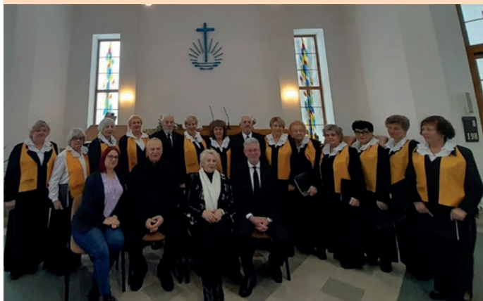
Ansamblis „Gaida“ po koncerto Šiauliuose Koncertas Klaipėdos bendruomenėje