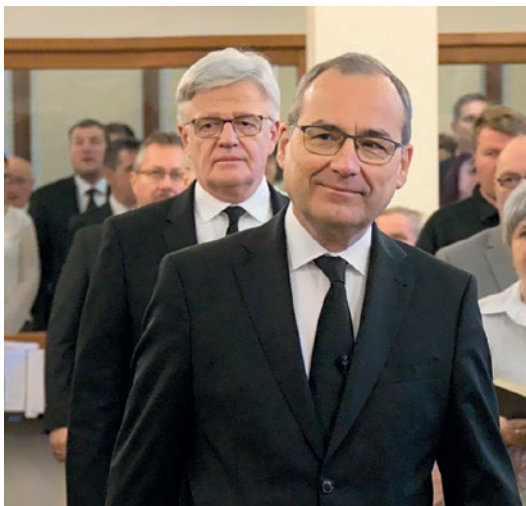
გამოცხ. 20, 6

„ნეტარია და წმიდაა ის, ვისაც აქვს წილი პირველ აღდგომაში.