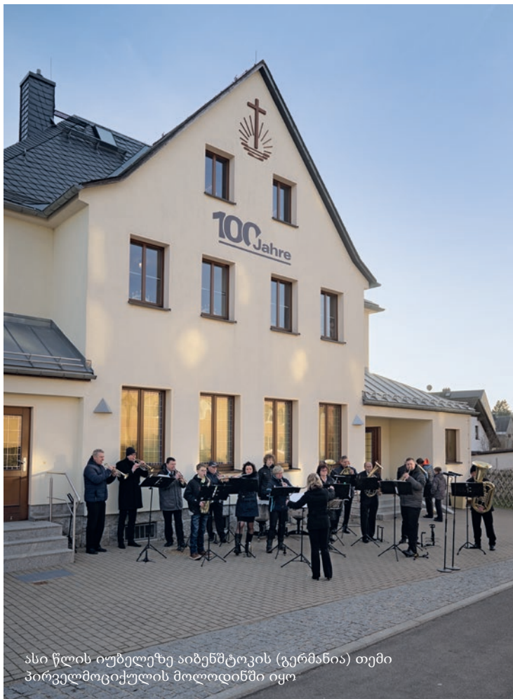
ასი წლის იუბილეზე აიბენშტოკის (გერმანია) თემი პირველმოციქულის მოლოდინში იყო

მასზე ხელმწიფება არ აქვს მეორე სიკვდილს, არამედ ისინი იქნებიან მღვდლები ღვთისა და ქრისტესი და იმეფებენ მასთან ერთად ათას წელს.“