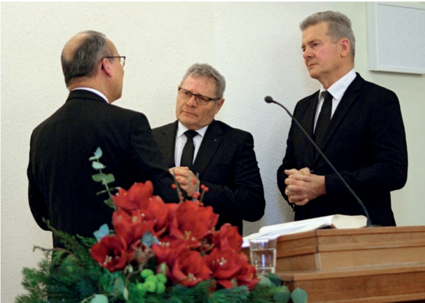
განსვენებულთათვის ჩატარებული ზიარება მეტად ამაღლებველი იყო.

გაუვათ. ეშმაკი ვერ მაიძულებს იმის გაკეთებას, რაც მას სურს. ქრისტეს დახმარებით ჩემს ცხოვრებასა და ბუნებას თვითონ გავაკონტროლებ.