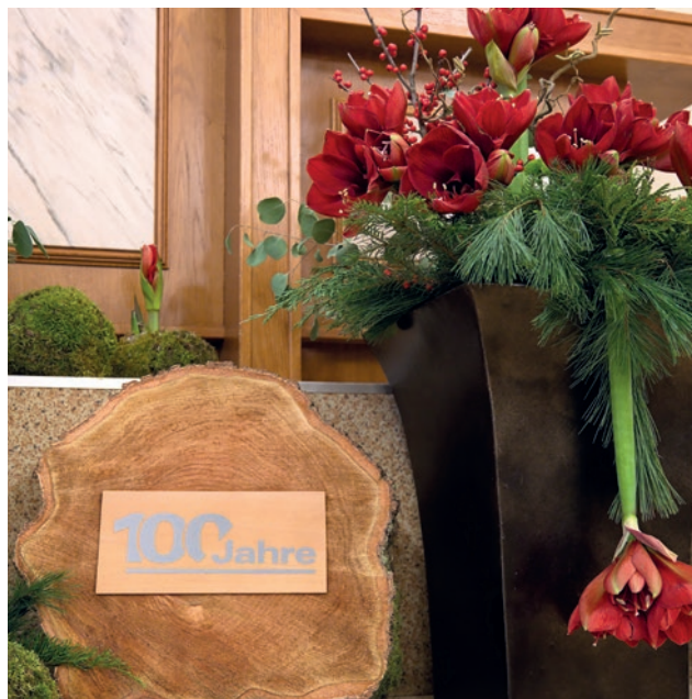
Bashkësia kishte kohë që përgatitej me një gëzim të madh për vizitën e apostulit kryesor

qëndronin besnikë, nëse me gjithë vështirësitë nuk panë arsye për t'u dorëzuar, pse duhet të themi sot: "Po, por nuk mundemi." Nuk ka arsye të dorëzohemi! Le të vazhdojmë të ndjekim Zotin. Atë që bëri njëqind vjet më parë, do të vazhdojë ta bëjë për ne edhe në të ardhmen. Ai do të na japë gjithmonë forcën për të qëndruar besnikë deri në fund. Le të ndalemi me ankesat dhe ankimet e përjetshme. Nuk është më e vështirë se sa ishte për paraardhësit tanë. Zoti është besnik. Ai do të na japë forcën që na nevojitet për të qëndruar besnikë deri në fund. Dhe kushdo që e dëshiron vërtet do ta arrijë atë.