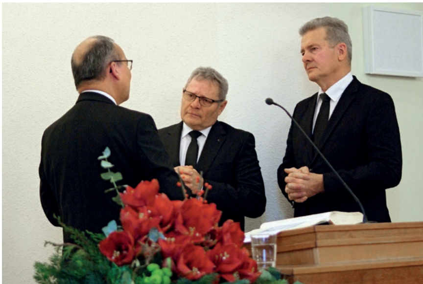
Prekëse ishte edhe ndarja e Bukës së Shenjtë për të larguarit nga kjo botë

thotë të sundosh! Ne duhet të sundojmë mbi mëkatit. Natyrisht ne jemi subjekt i tundimit. Por në Katekizëm thuhet: Njeriu nuk i ekspozohet tundimit pa vullnetin e tij. Ndonjëherë kemi përshtypjen se nuk mund të bëjmë, të veprojmë ndryshe. Ne rrëmbehemi nga fluksi i njerëzve. Jo, ne nuk jemi të detyruar të bëjmë gjithçka që na sugjerohet, të bëjmë gjithçka që bëjnë të tjerët. mund të themi jo Mëkati vjen deri në derën tuaj, por ju sundoni mbi të. Me ndihmën e Krishtit, ju mund t'i thoni 'jo' mëkatit. Ju mund të thoni, "Jo, unë nuk po e bëj këtë, pavarësisht nga pasojat për mua, është mëkat, është kundër vullnetit të Zotit." Le të sundojmë jetën tonë dhe të marrim nën kontroll jetën tonë dhe veten. Po, ka shumë njerëz që thonë se sot njerëzit janë thjesht kukulla, dikush po i tërheq fjetet dhe në fakt mund të bësh çfarë të duash me ta. Por jo me mua. Djalli nuk mund të bëjë çfarë të dojë me mua. Me ndihmën e Krishtit mund të kontrolloj jetën dhe natyrën time.