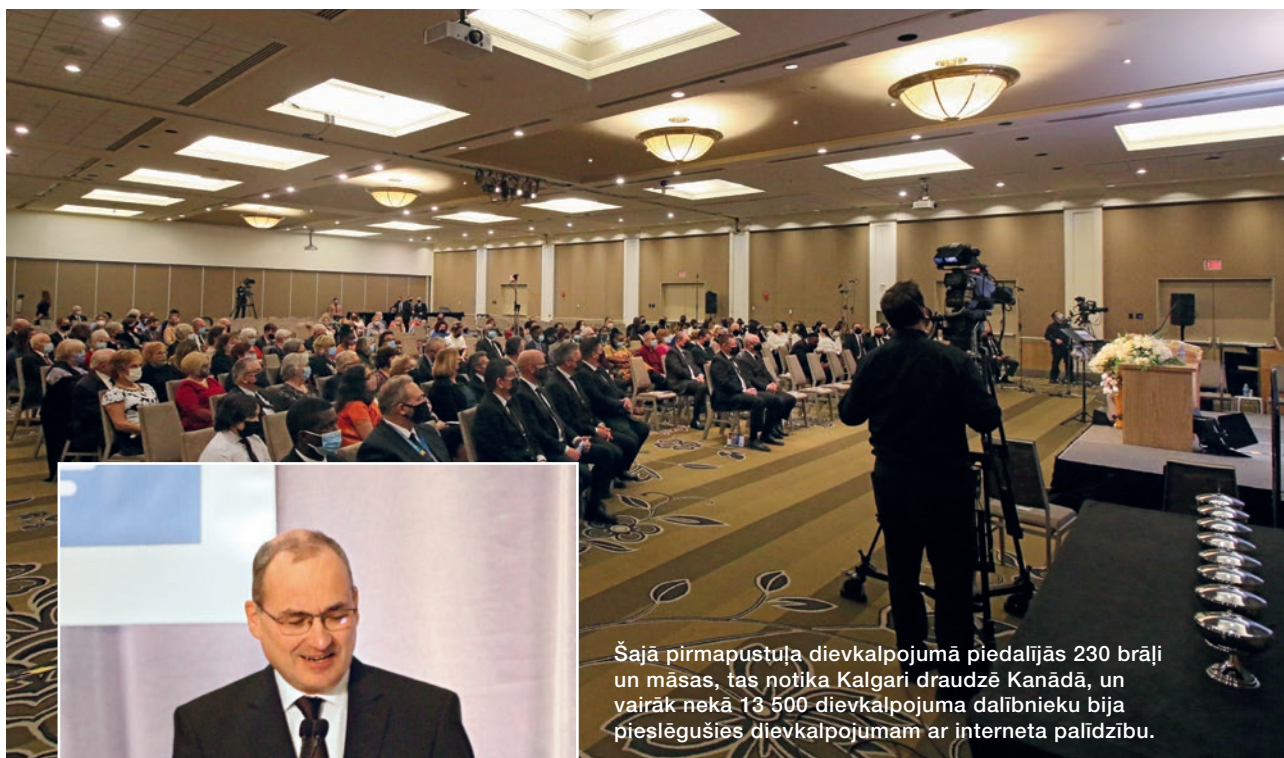
Attēls: Kanādas Jaunapustuliska baznīca