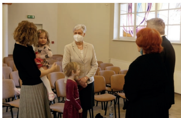
Pirms svētās apzīmogošanas