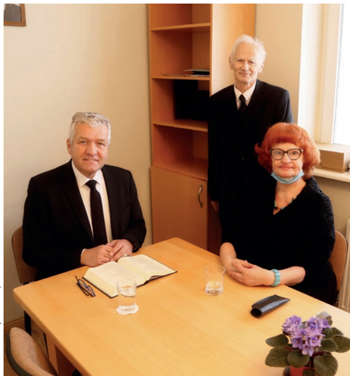
Attēls: Latvijas Jaunapustuliskā baznīca