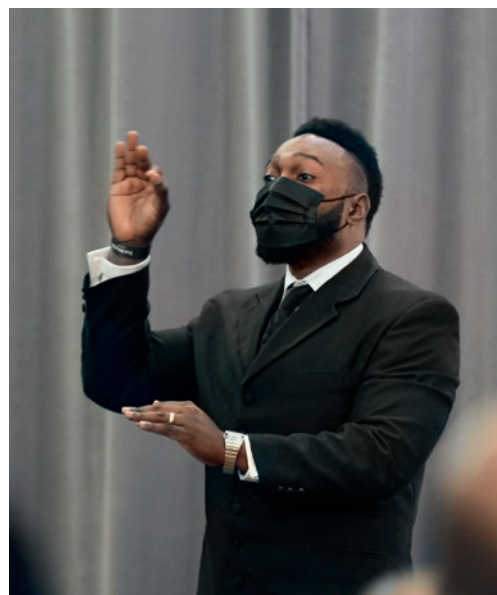
Dievkalpojuma apmeklētājus iepriecina koris

debesīs Dieva godībā, kur viss ir pilnīgs, svēts un brīnišķīgs. Viņš atstāja šo godību, lai nāktu uz zemi un dalītos ar cilvēkiem viņu dzīves apstākļos. Viņš dalījās ar tiem priekos un ciešanās, un viņu dzīvē. Viņš uzņēmās pat nāvi, jo arī cilvēkiem ir jāmirst. Viņš atstāja savu debesu godību, lai parādītu solidaritāti, lai kļūtu tas, kas mēs esam, tas ir, pieņēma cilvēka būtību, lai glābtu mūs no mūžīgās nāves varas. Ja mēs nesam savās sirdīs šo Jēzus Kristus mīlestību, kas tad notiek? Tad mēs esam kopā ar mūsu tuvāko. Mēs esam gatavi atstāt savu komforta zonu, lai palīdzētu, ja mēs redzam, ka mūsu tuvākais cieš, ka tam šajā brīdī kaut kas ir nepieciešams. Ērti tas nav. Ir vienkāršāk ignorēt to, kurš cieš. Mani bieži vien pārņem sajūta, ka ciešanas ir lipīgas, jo tikmēr, kamēr kāds ir nelaimīgs, pārējie cenšas novērsties no viņa. Bet tās nav lipīgas! Atstāsim savu komforta zonu, lai atrastos blakus savam tuvākajam, dalītos ar viņu sāpēs un ciešanās, mierinātu viņu un palīdzētu viņam. Un Jēzus lielais lūgums attiecībā uz savējiem bija, lai tie būtu kā viens vesels - kā Viņš ar savu Tēvu (Jāņa 17, 20.21). Jēzus zināja, ka nav iespējams būt kopībā ar Tēvu un Viņa Dēlu, ja nav šīs kopības mācekļu starpā. Viņš brīdināja tos palīdzēt viens otram: „Ko jūs darāt viņiem, to darīt man.” Tātad vēlreiz: ja jūs vēlaties būt kopībā ar Kristu, jums ir jābūt savstarpēji kopībā Kristū!