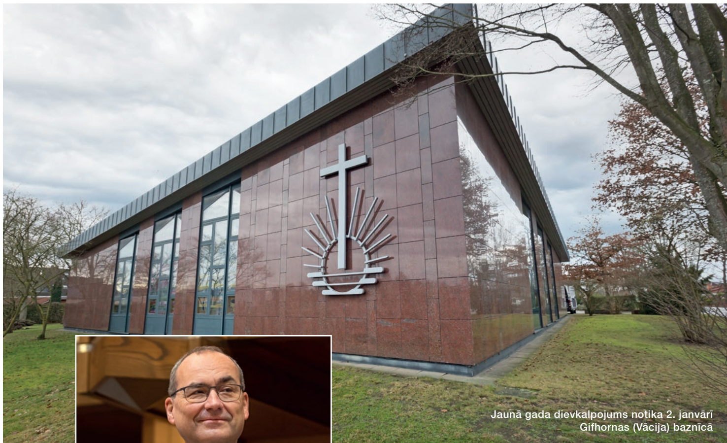
Jaunā gada dievkalpojums notika 2. janvārī Gifhornas (Vācija) baznīcā