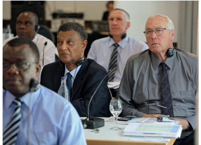
Apriņķa apustuļa palīgi, apriņķa apustuļi un pirmapustulis apriņķa apustuļu konferencē

publicēta tēma „Vīrieša un sievietes līdzības Dieva attēlam”. Tēmas galvenie apgalvojumi ir šādi: