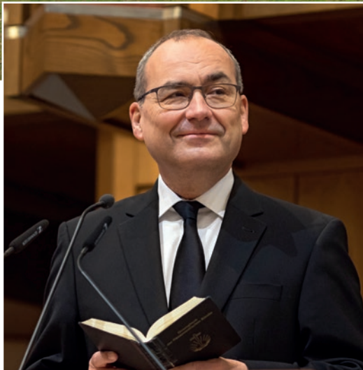
მოციქულთა საქმეები 2, 44

„ყველა მორწმუნე ერთად იყო და ყველაფერი საერთო ჰქონდათ.“