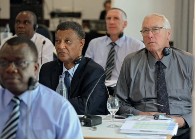
სამხ. მოციქულის თანაშემწეები, სამხ. მოციქულები და პირველმოციქული სამხ. მოციქულთა კონფერენციაზე

არის დამოკიდებული ავტორებზე - იმის მიუხედავად, იყვნენ ისინი მოციქულები და წინასწარმეტყველნი თუ არა.