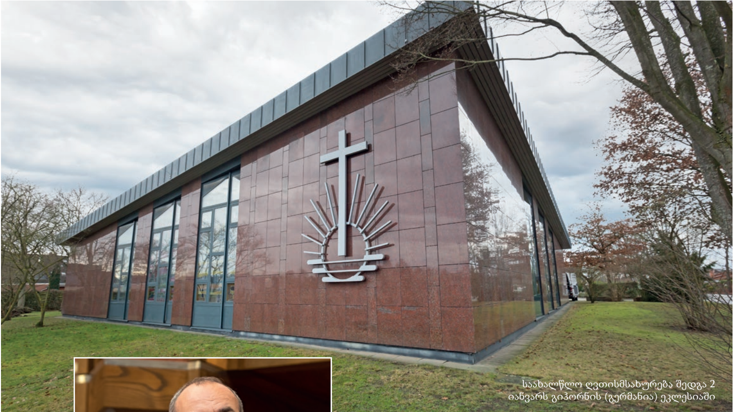
საახალწლო ღვთისმსახურება შედგა 2 იანვარს გიჰორნის (გერმანია) ეკლესიაში