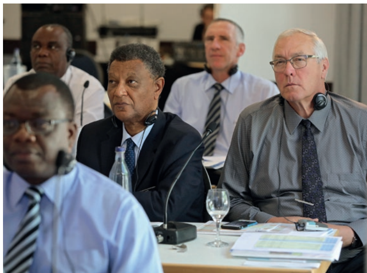
Ndihmësat e Apostujve të Distriktit, Apostujt e Distriktit dhe Apostuli Kryesor në Konferencën e Apostujve të Distriktit.

Të kuptuarit e detyrave nga ana e grave dhe e burrave është i ndryshëm sepse pasqyron, ndër të tjera, zhvillimet sociale dhe politike brenda shoqërisë njerëzore.