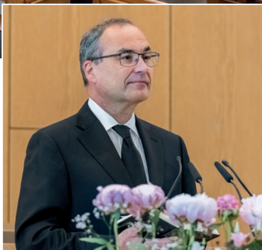
რომ. 8, 14

„რადგან ისინი, ვინც ღვთის სულით წარიმართებიან, ღვთის შვილები არიან.“