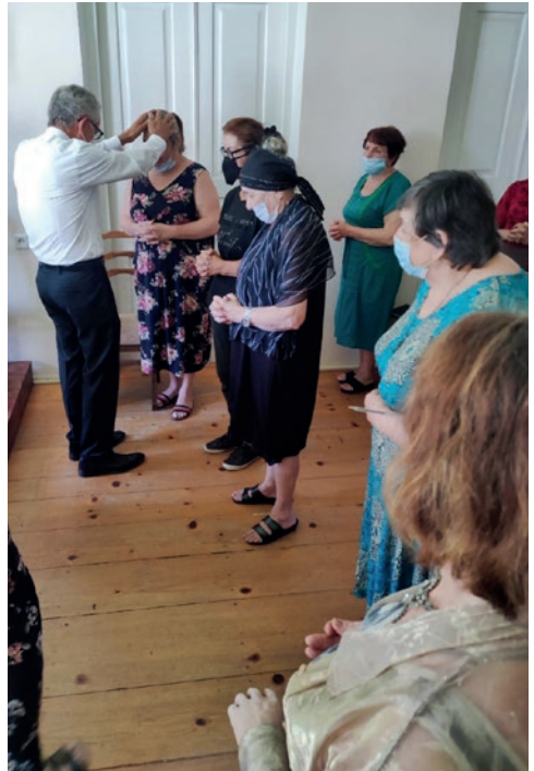
ბათუმის თემი სულიწმიდით აღბეჭდვა ბათუმის თემში

სამარიელის იგავით უპასუხა. როგორც მოციქულმა აღნიშნა, მოყვასის სიყვარული ოჯახის წევრებისა და ახლობლების სიყვარულისგან განსხვავდება. მოყვასის სიყვარულში მტრის სიყვარულიც შედის, ასევე გაჭირვებულის სიყვარულიც, რომელსაც დახმარება სჭირდება. ამის განხორციელება არ არის იოლი, მაგრამ მორწმუნე უნდა შეეცადოს, მიზამოს იესოს მაგალითს.