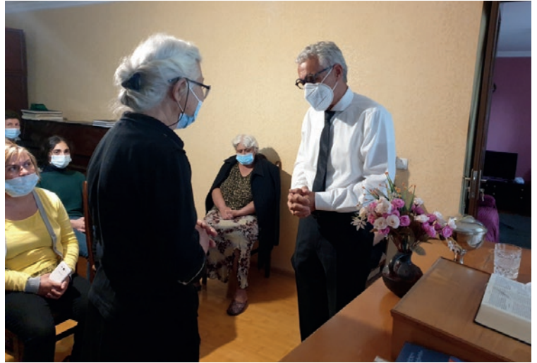
სამხ. მახარებელი რენე ფოლმანი სულიწმიდით აღბეჭდვა ახმეტის თემში

მეორე წელია, რაც მთელ მსოფლიოში კოვიდ 19-ის პანდემია მძვინვარებს. ვირუსის გავრცელების კუთხით, არსებული მდგომარეობა საქართველოშიც მძიმეა. მისი გავრცელების დრო, მოქმედების არეალი, სიცოცხლისუნარიანობა, სიმპტომებიც კი ცვალებადობით ხასიათდება. პანდემიამ გამოიწვია ის, რომ მოულოდნელად გაჩერდა პოლიტიკური, ეკონომიკური და სოციალური ცხოვრება. ზოგი მორწმუნე ამ მდგომარეობას ათ ეგვიპტურ ჭირსაც ადარებდა. შეიცვალა ეკლესიური ცხოვრების მრავალწლიანი ტრადიციული ფორმებიც. ეს საერთაშორისო ახალსამოციქულო ეკლესიასაც შეეხო, მათ შორის საქართველოშიც. ვერავინ წარმოიდგენდა, რომ საიდუმლოების მიღება სახიფათო შეიძლებოდა გამხდარიყო ჯანმრთელობისთვის. ჩვენ პირნათლად ვასრულებთ დაწესებულ რეგულაციებს, რათა თავიდან ავიცილოთ თემებში დაავადების გავრცელება.