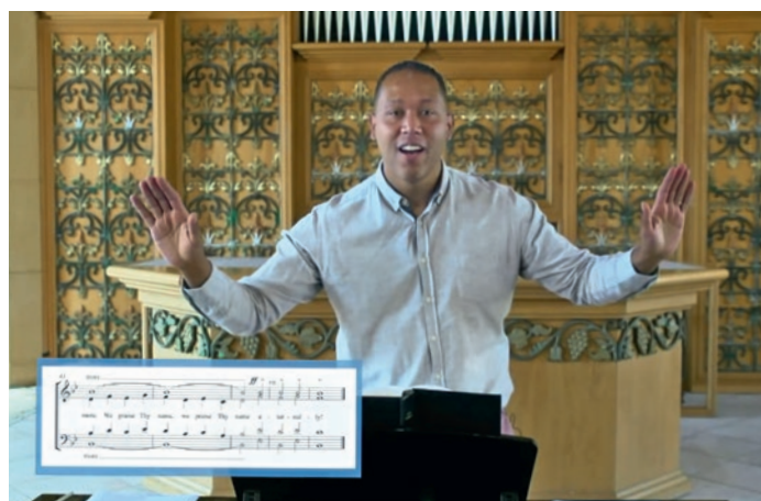
Virtuali choro repeticija: dirigentas yra bažnyčioje, giesmininkės ir giesmininkai – namuose

Daugeliui žmonių koronaviruso krizė yra tik dar viena ekstremali situacija, su kuria jie turi susidoroti. Visų pirma pietinėse pasaulio šalyse jau seniai kovojama dėl egzistencijos. Naujosios apaštalų bažnyčios pagalbos organizacijos padarė viską, kad padėtų joms išvengti blogiausio scenarijaus. Talkininkai susidūrė su visiškai naujais iššūkiais, kuriuos galima įveikti tik neįprastomis idėjomis.