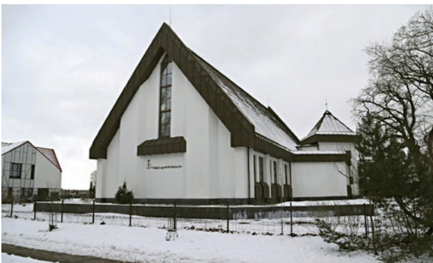
Šilutės bažnyčia ▼

Dėl pablogėjusios epidemiologinės situacijos dabar pamaldos laikomos didžiosiose LNAB bendruomenių bažnyčiose – Klaipėdoje, Šilutėje, Panevėžyje, Kaune. Visose kitose bendruomenėse pamaldų laikymas bus atnaujintas pasibaigus karantinui.