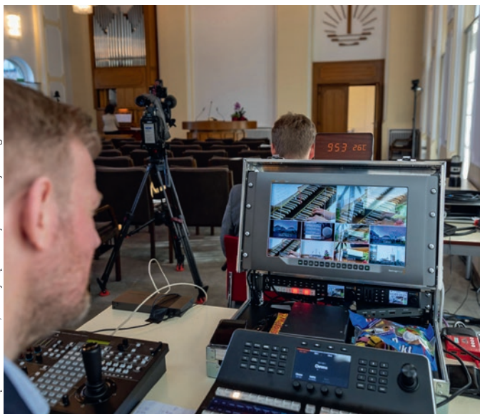
Kairėje: pamaldų vaizdo transliacija Apačioje: giesmininkės ir giesmininkai susitinka virtualiuose choruose