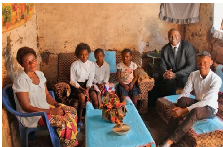
Šventoji Vakarienė švenčiama su krašto apaštalu Tshitshi Tshisekedi – namuose, kadangi bažnyčios uždarytos