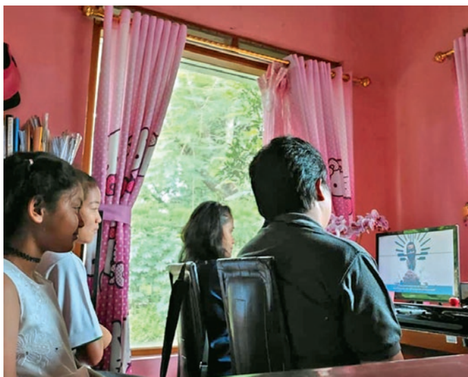
Švęsti pamaldas savo namų svetainėje