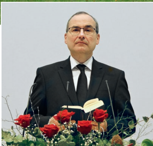
Երբայեցիներին 12, 1,2

„ Համբերությամբ ընթանանք դեպի մրցասպարեզ, որ բացված է մեր առաջ, նայենք Հիսուսին՝ հավատի գորագլխին, այն կատարելագործողին,„: