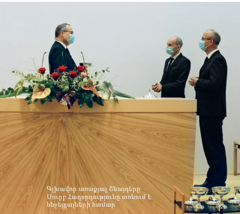
Գլխավոր առաքյալ Շնայդերը Սուրբ Հաղորդությունը տոնում է ննջեցյալների համար

իրավիճակում, ինչպիսին էլ որ լինի այդ վիճակը, կողմնորոշվում ենք մեր Տեր և Վարդապետ Հիսուս Քրիստոսի օրինակով: Հիսուս Քրիստոսի կերպարը շատ պարզ է նկարագրված՝ նա սիրո մարդ էր, նա ներում էր, օգնում էր, տալիս էր, ծառայում էր-,,որովհետև մարդու Որդին էլ չեկավ ծառայություն ընդունելու, այլ ծառայելու,, / Մարկոս 10,45/; նա իրեն գոհաբերում էր մերձավորի համար և կիսում էր նրա վիշտը: Սա է մեզ համար օրինակելին նաև դժվար ժամանակներում: