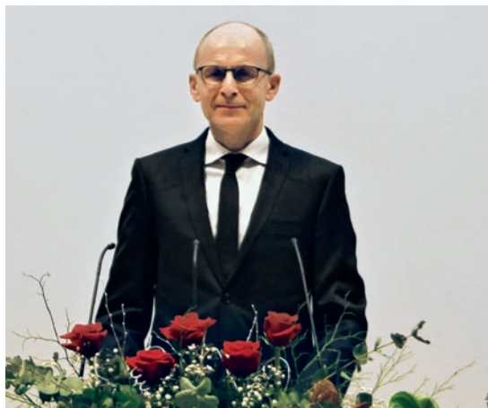
Եպիսկոպոս Ռուդոլֆ Ֆեսսլեր / Շվեյցարիա/

մենք այն մասին մտածենք, թե ինչ ենք անում, ինչ ենք վաստակում կամ զոհաբերում, ապա մենք չենք հասնի մեր նպատակին: