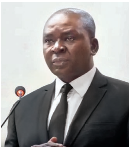
Առաքյալ Գաբրիել Մվեմենան