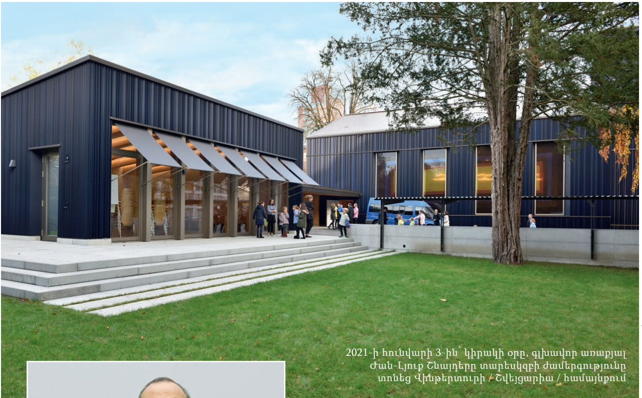
2021-ի հունվարի 3-ին՝ կիրակի օրը, գլխավոր առաքյալ Ժան-Լյուք Շնայդերը տարեսկզբի ժամերգությունը տոնեց Վինթերտուրի / Շվեյցարիա / համայնքում