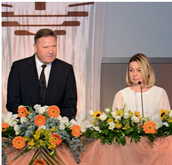
Aprīņa apustulis Rainers Štorks (Rietumvācija)