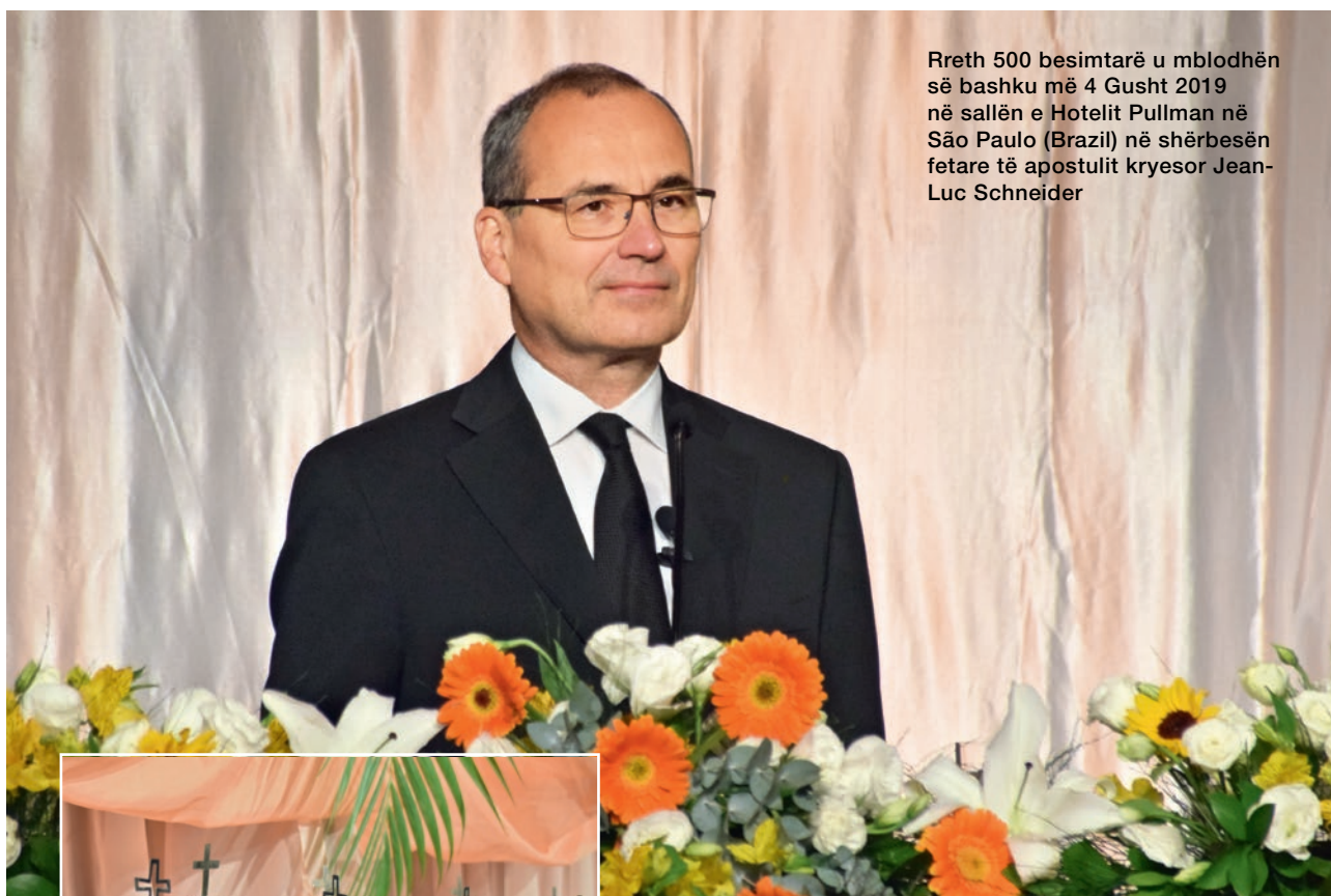
Rreth 500 besimtarë u mbledhën së bashku më 4 Gusht 2019 në sallën e Hotelit Pullman në São Paulo (Brazil) në shërbesën fetare të apostulit kryesor Jean-Luc Schneider