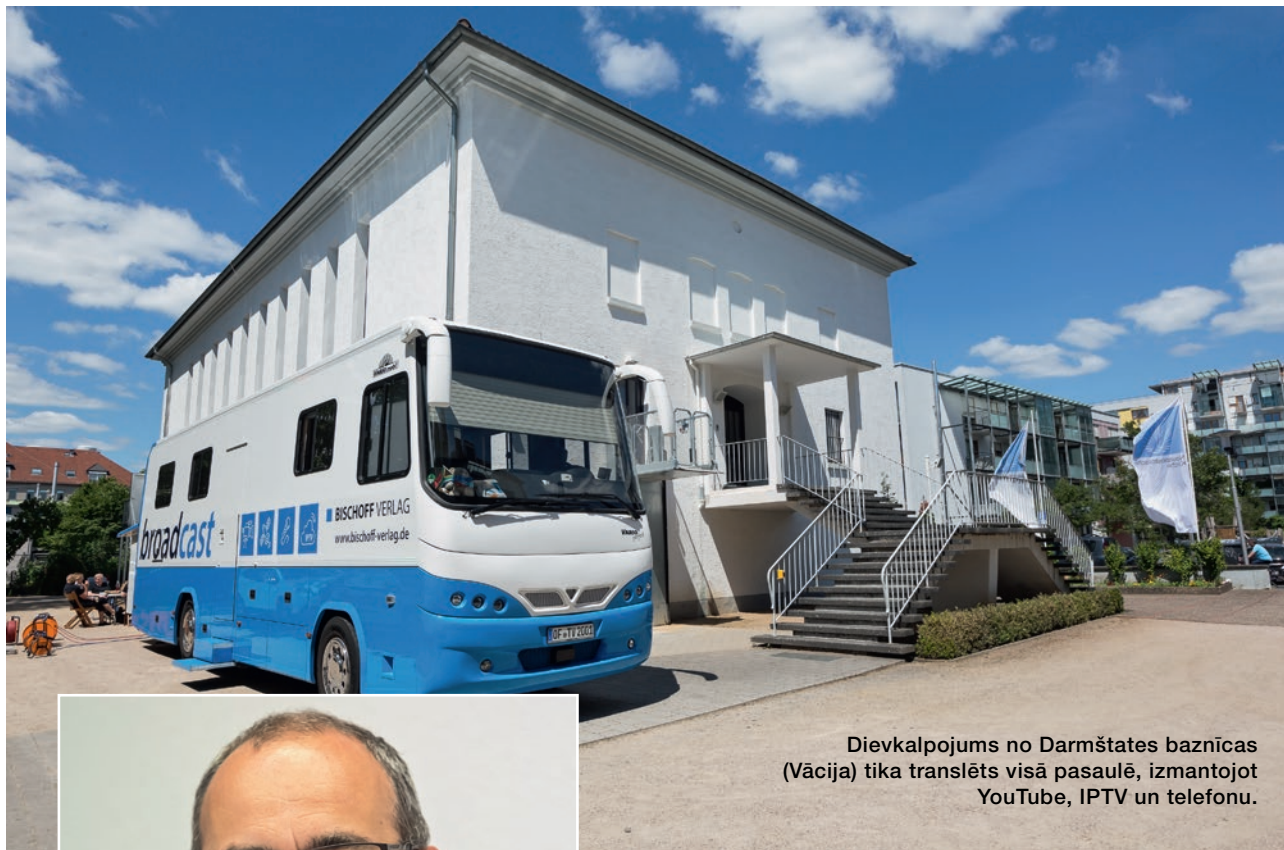
Dievkalpojums no Darmšates baznīcas (Vācija) tika translēts visā pasaulē, izmantojot YouTube, IPTV un telefonu.