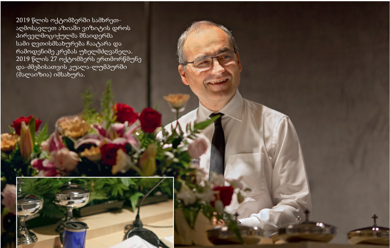
ფოტო: სამხრეთ-აღმოსავლეთ აზიის ახსე

2019 წლის ოქტომბერში სამხრეთ-აღმოსავლეთ აზიაში ვიზიტის დროს პირველმოციქულმა შნაიდერმა სამი ღვთისმსახურება ჩაატარა და რამოდენიმე კრებას უხელმძღვანელა. 2019 წლის 27 ოქტომბერს ერთმორწმუნე და-ძმებისათვის კუალა-ლუმპურში (მალაიზია) იმსახურა.