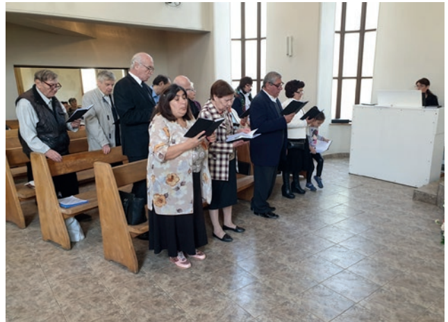
ავლაზრის თემის გუნდი

ორი წლის მერე, 2019 წლის 26-28 ოქტომბერს, სამხ. მოციქული რაინერ შტორკი საქართველოსა და აზერბაიჯანის თემებს ესტუმრა.