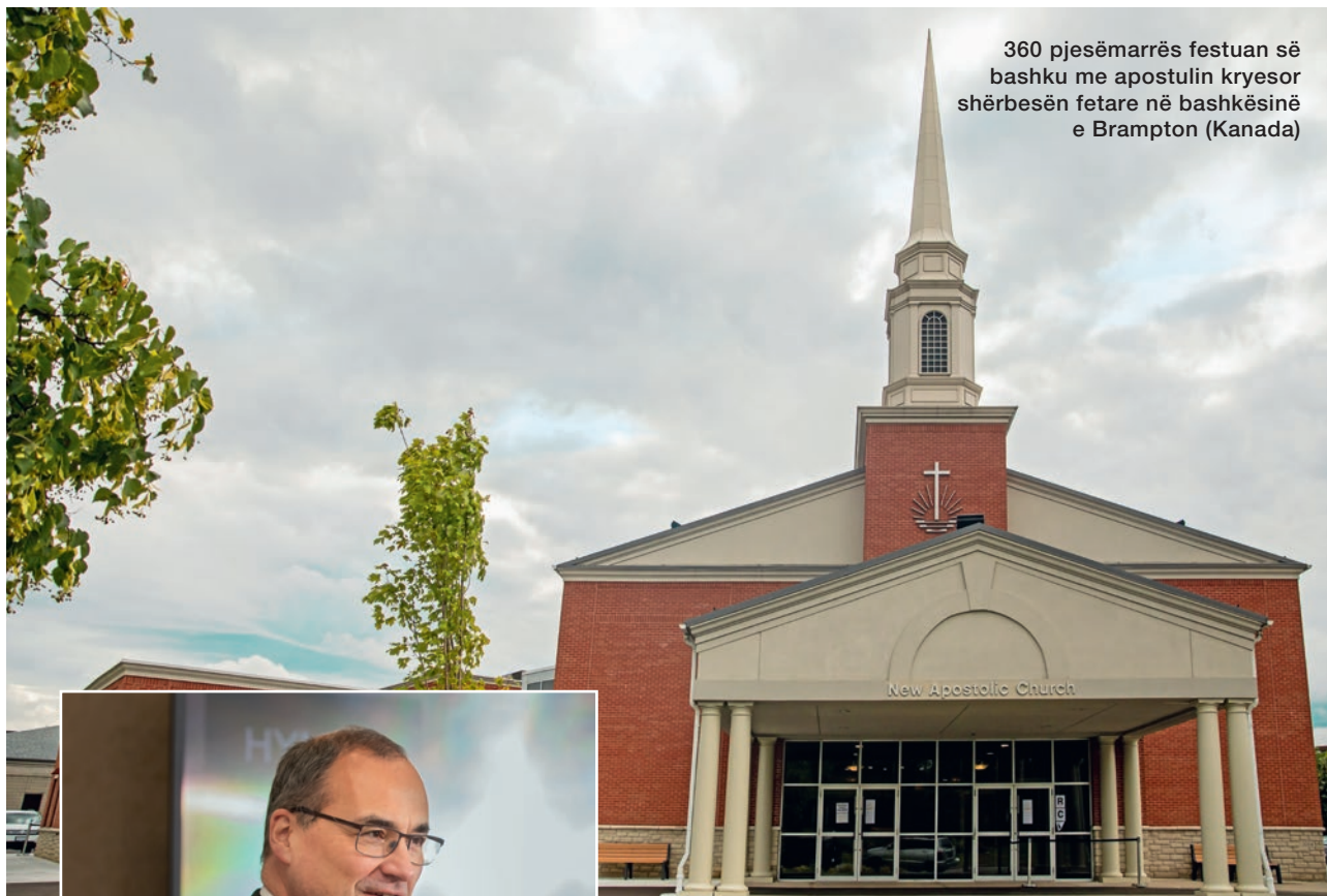
360 pjesëmarrës festuan së bashku me apostulin kryesor shërbesën fetare në bashkësinë e Brampton (Kanada)