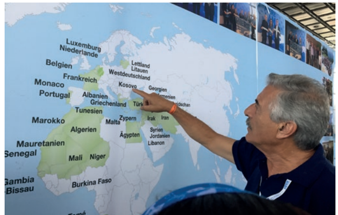
Apostuli Luis tregon vendet që ka vizituar