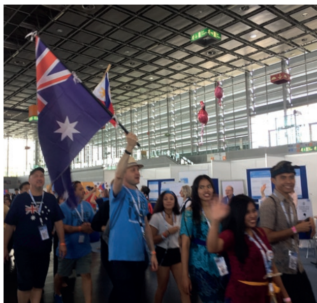
Vëllezër e motra nga kontinente të ndryshme