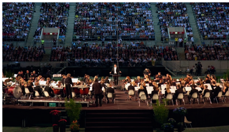
Nuotraukos, kurios netrukus pasirodys: Europos Jaunimo Dienų 2009 nuotraukas pakeis IJT 2019