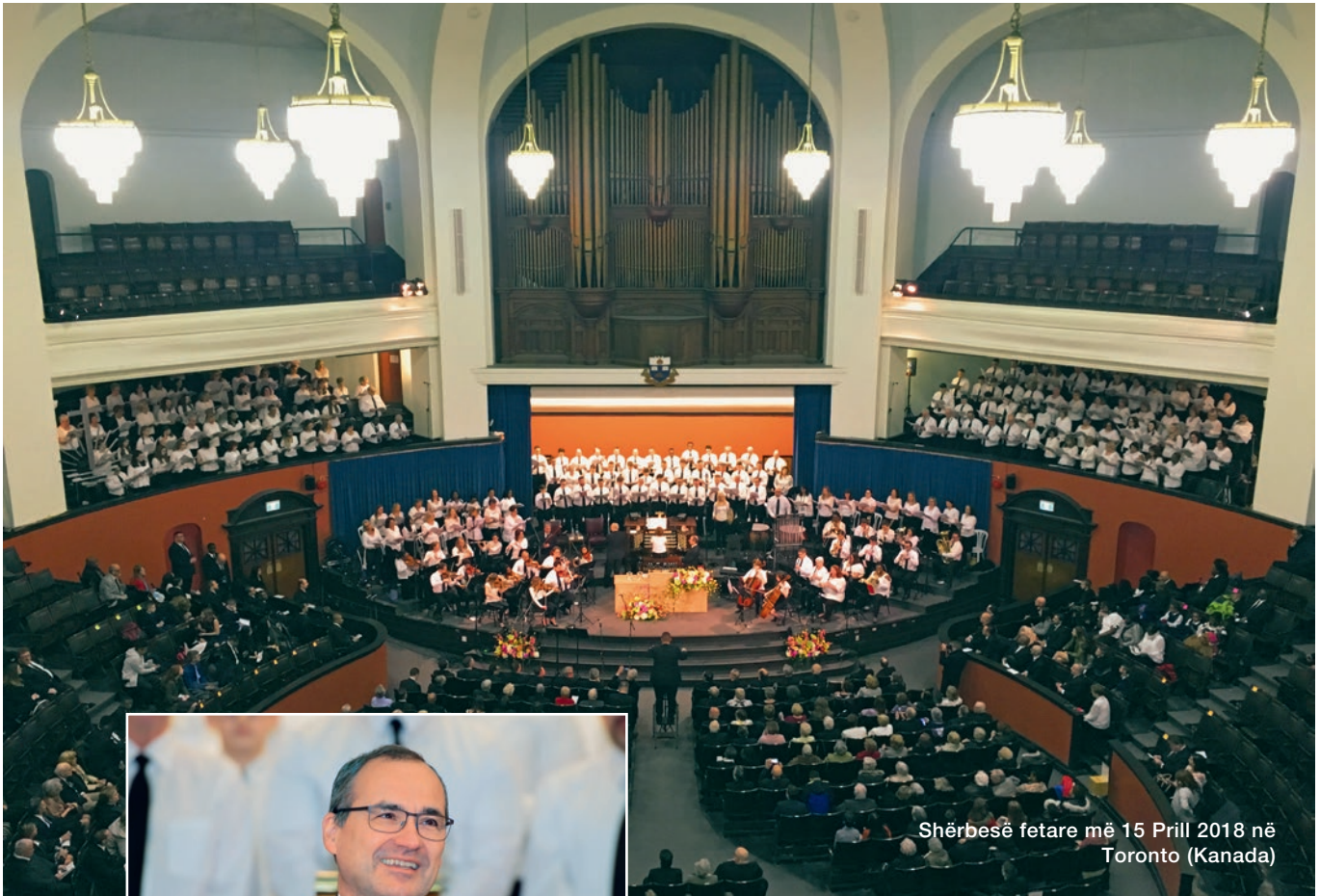
Shërbesë fetare më 15 Prill 2018 në Toronto (Kanada)