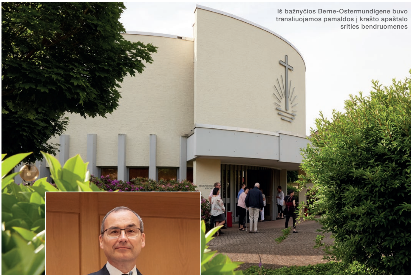
Iš bažnyčios Berne-Ostermündigene buvo transliuojamos pamaldos į krašto apaštalo srities bendruomenes