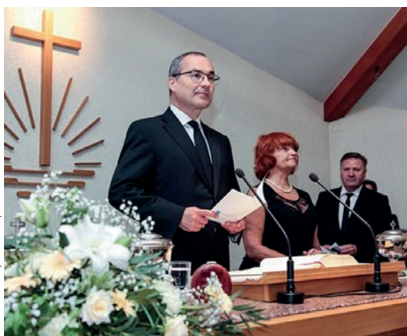
Pirmapustulis Šneiders pie altāra