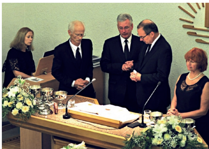
Svētā vakarēdiena nodošana dvēselēm mūžībā Projektora un ansambļa kopbilde

„Mēs veicam savu darbu tur, kur Viņš mūs ir sūtījis, un izpildīsim savu kalpošanu līdz beigām,” uzmundrināja pirmapustulis. Panākums bieži vien nav mērojams skaitļos: „Mūsu panākums ir tas, ka mēs pildām līdz galam Dieva gribu.” Un kalpošanu Dievs svētīs.