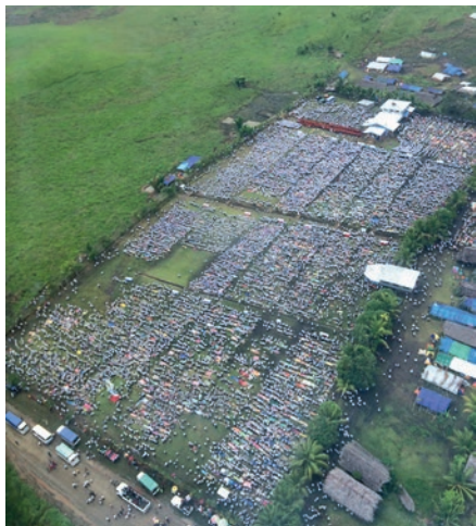
24.000-ზე მეტ მონაწილეს ითვლიდა ღვთისმსახურება პაპუა-ახალ გვინეაში.

ღმერთმა ადამიანებიც მოგვცა, რომლებიც ჩვენს გარშემო არიან. წყალობაა, ჰყავდეს ადამიანს ქმარი ან ცოლი. განსაკუთრებული წყალობა კი შვილების ყოლაა. სხვა ადამიანების გერემოცვაში ყოფნაც წყალობაა. ჩვენი ცხოვრება მძიმე იქნებოდა, სულ მარტო რომ ვყოფილიყავით. ხშირად სხვის დახმარებაზე ვართ დამოკიდებულნი. წყალობაა, როცა ოჯახის ნაწილი ხარ. დიდი წყალობაა ერთი რომელიმე ერის ნაწილად ყოფნა. ღმერთმა სიყვარულითა და სიბრძნით რჯული მოგვცა: მცნებები. ეს მადლია, ვინაიდან, თუ ამ მცნებების მიხედვით ვიმოქმედებთ, თანაცხოვრება მშვიდობიანი და გაწონასწორებული შეიძლება