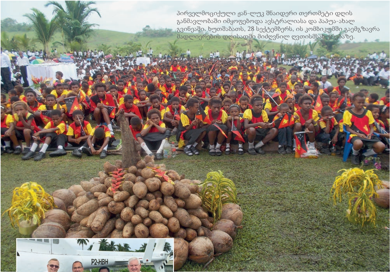
პირველმოციქული ჟან-ლუკ შნაიდერი თერთმეტი დღის განმავლობაში იმყოფებოდა ავსტრალიასა და პაპუა-ახალი გვინეაში. ხუთშაბათს, 28 სექტემბერს, ის კომბიკუმში გაემგზავრა მადლიერების დღისადმი მიძღვნილ ღვთისმსახურებაზე.