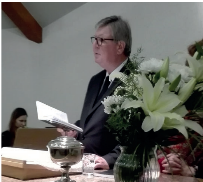
Apustulis Šorrs pie altāra

1.novembrī, trešdienas vakarā, Rīgas baznīcā notika apustuļa Šorra dievkalpojums, kurā viņš kalpoja Rīgas un Siguldas draudžu brāļiem un māsām ar vārdu no Mateja evaņģēlija: