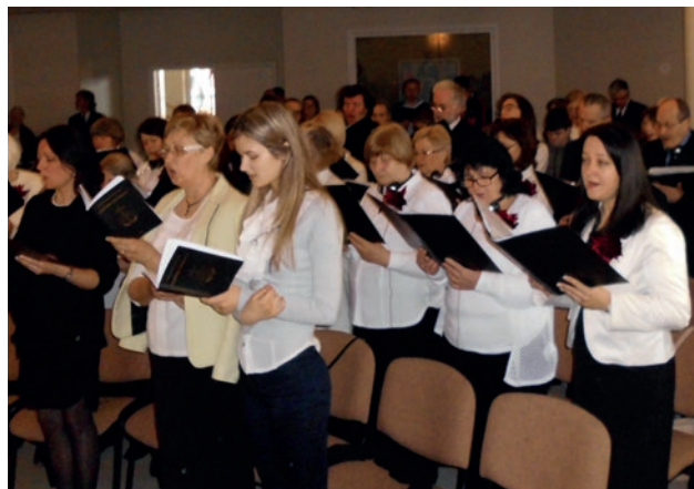
Aprīņķa apustuļš pie altāra Projektķoris no Lietuvas

30.aprīlī, plkst. 11.00, notika aprīņķa apustuļa Rainera Štorķa dievkalpojums, uz kuru bija sapulcējušies visi brāļi un māsas no Latvijas draudzēm, kā arī projektķoris no Lietuvas diriģentes Astas vadībā. Aprīņķa apustuļš šo amatu ieņēķ kopš 2014. gada 23. februāra, nomainot aprīņķa apustuļi Armīnu Brinkmani.