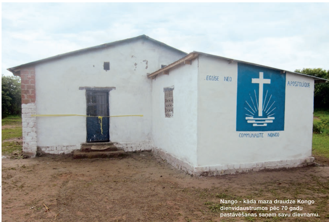
Nango - kāda maza draudze Kongo dienvidaustrumos pēc 70 gadu pastāvēšanas saņem savu dievnamu.