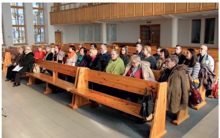
Projektinio choro dalyviai

LNAB bendruomenių atstovų susitikime Kaune buvo nuspręsta surinkti po vyskupo sukurtu laišku LR Seimo nariams bažnyčios tikinčiųjų ir ją palaikančiųjų parašus.