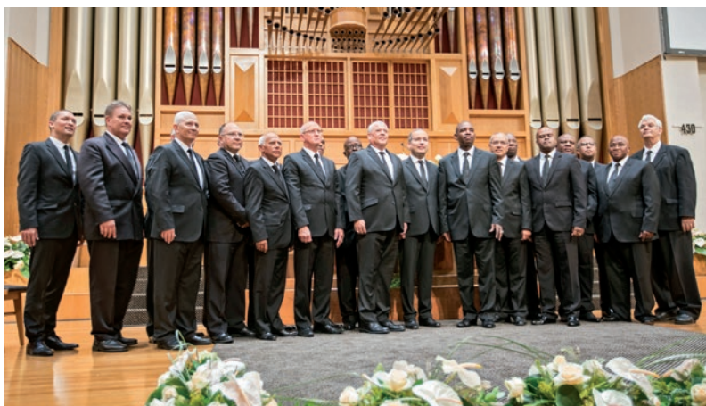
Pirmapustulis Šneiders kopā ar apustuļiem Dienvidāfrikas jaunajā apgabala baznīcā