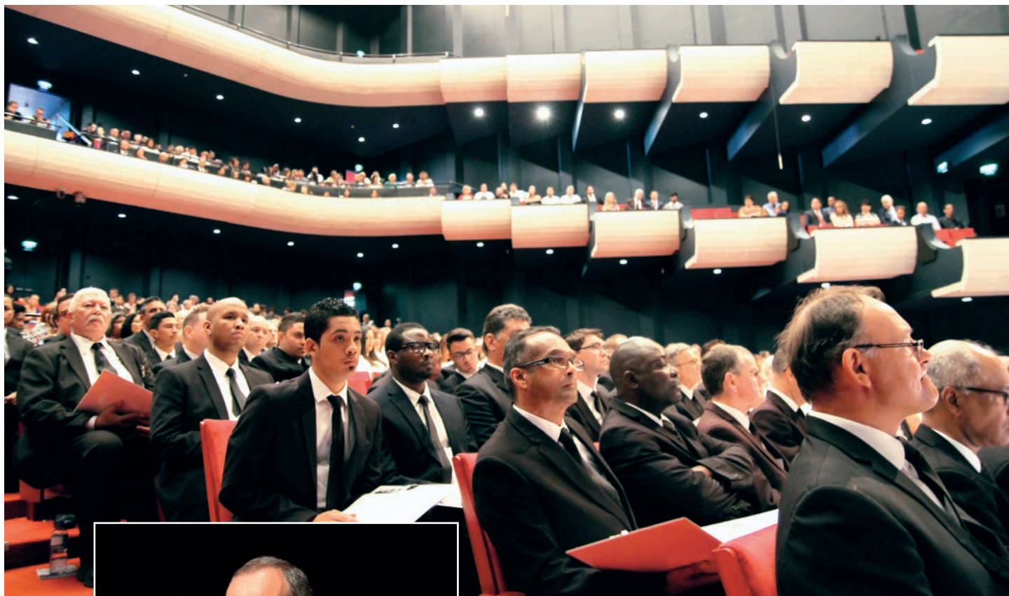
Attēls: Austrālijas Jaunapustuliskā baznīca

Aptuveni 1000 ticīgo sapulcējās uz dievkalpojumu Pērtā kopā ar pirmapustuli Šneideru. Vairāk nekā 1300 jaunapustulisko kristiešu piedzīvoja dievkalpojumu ar video translācijas palīdzību pārējās Austrālijas draudzēs.