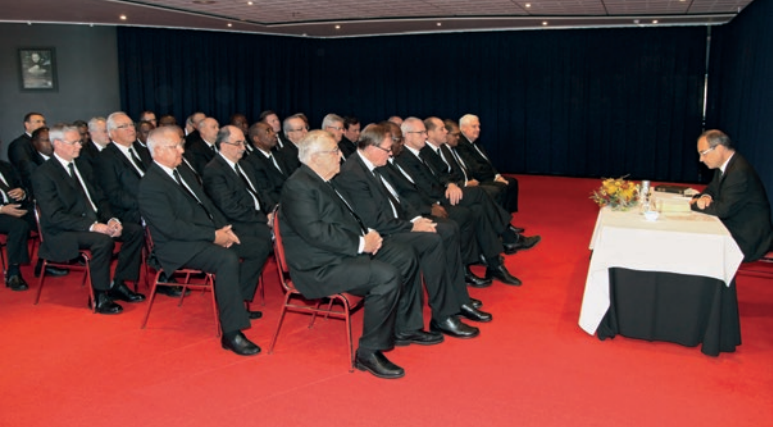
Գլխավոր առաքյալին ուղեկցում էին 17 շրջանային առաքյալ և շրջանային առաքյալի 7 օգնական: Սրանից առաջ, նա նրանց հետ եղել էր նաև աշնանային հավաքույթի օրերին:

երևույթները իրականացել, որոնք մարդկանց մոտ անհնար են: Մենք հույս ունենք Աստծո հանդեպ, մենք նրան ենք ներկայացնում մեր ցանկությունները և գիտենք, որ նա դրանք կարող է իրականացնել, եթե դրանք իր կամքով լինեն: Դա քրիստոնեական հավատի վրա հիմնված հույսն է, որ այլ մակարդակի