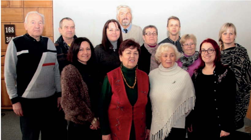
Chorvedžių ir vargonininkų seminaro dalyviai