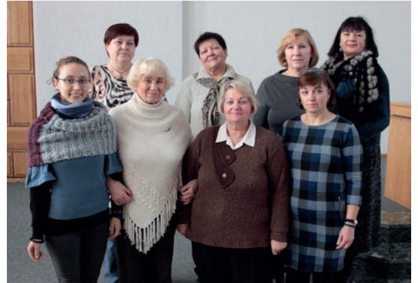
Sekmadienių mokyklėlių mokytojos seminare