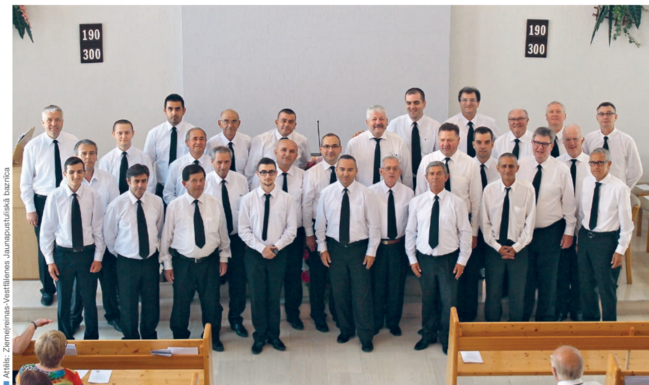
Attēls: Ziemeļreinas-Vestfālenes Jaunapustuliskā baznīca