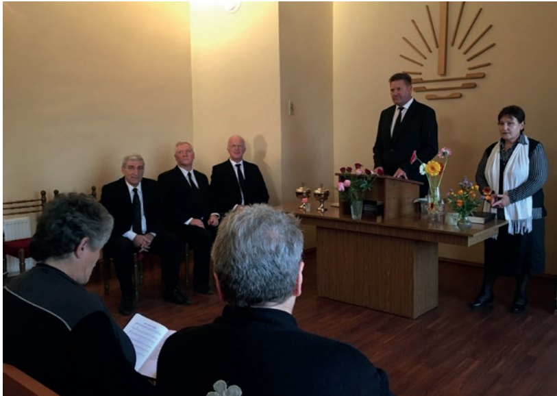
Շրջանային առաքյալ Ռ, Շթորքը ինտերակտիվ գրույց է անցկացնում Գյումրիի համայնքում