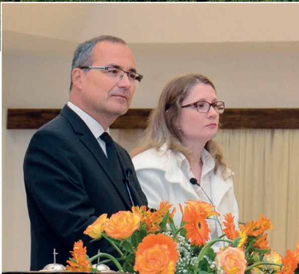
Ղուկաս 7; 47,48

Դրա համար քեզ ասում եմ, իր անհամար մեղքերը կներեն սրան, որովհետև ուժգին սիրեց, քանզի ում շատ է ներվում, շատ է սիրում, և ում սակավ՝ սակավ: Եվ ասաց նրան՝ քո մեղքերը քեզ ներված են: