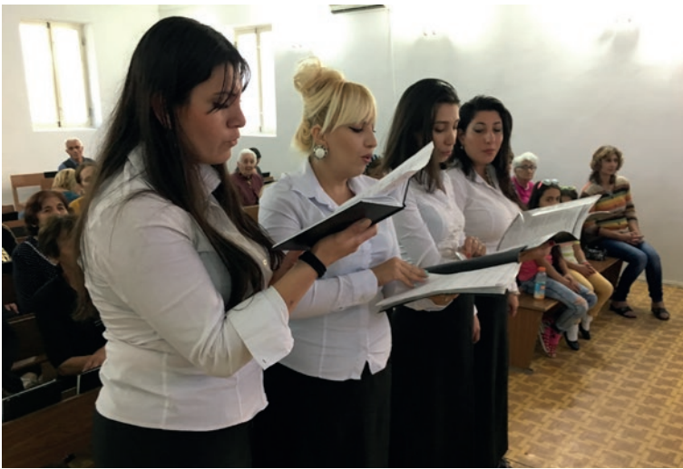
Երևանի համայնքի աղջիկների երգչախումբը հոգեպարար կատարումներով գեղեցկացնում է ժամերգությունը

Մի քիչ դադարից հետո, դժվարանցանելի ճանապարհով ուղևորվեցին դեպի Կաճաճկուտի համայնք: Ձմռան ամիսներին ձյան և զառիվեր ճանապարհի պատճառով համայնք այցելելը անհնար է դառնում: Ժամերգության 86 մասնակիցներ հետևում էին 2. Թեսաղոնիկեցիների 1;3-ի աստվածաշնչյան խոսքին. „ Եղբայրներ, պատրաստ ենք միշտ գոհություն մատուցել Աստծուն ձեզ համար, ինչպես որ արժանի իսկ է. քանի որ ավելի ու ավելի է աճում ձեր հավատը, և շատանում է ձեզնից յուրաքանչյուրի սերը միմյանց հանդեպ,„: