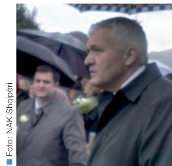
Apostuli Otten dhe vëllezërit e administratës tek varrezat

Bashkësia, në fillimin e shërbesës fetare, këndoi këngën 435,