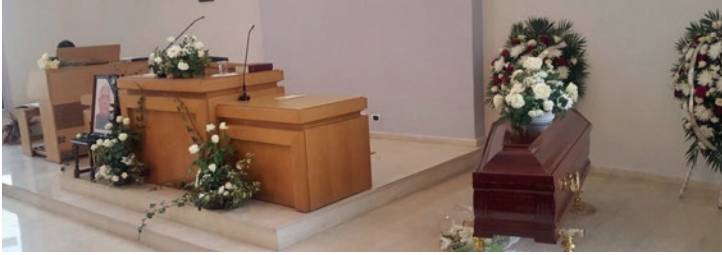
Pamje e altarit