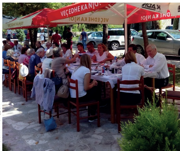
Bashkësia duke ngrënë drake në Shëngjergj

Direkt mbas mbylljes së shërbesës u bë edhe ngrënia e përbashkët e drekës me të gjithë motrat e vëllezërit. Shumë shpesh u përdor edhe organoja me rrotullim me dorë – këtë rradhë me muzikë nga bota, por takimi vazhdoi me këngë të shumta, me tregime e me të qeshura të shumta.