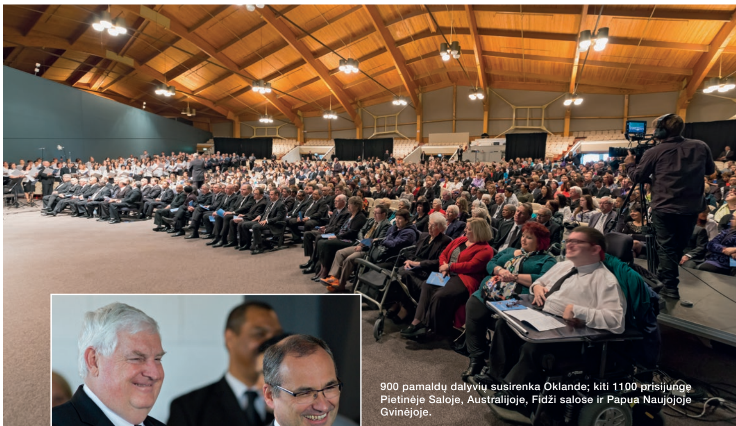
900 pamaldų dalyvių susirenka Oklande; kiti 1100 prisijungė Pietinėje Saloje, Australijoje, Fidži salose ir Papua Naujojoje Gvinėjoje.