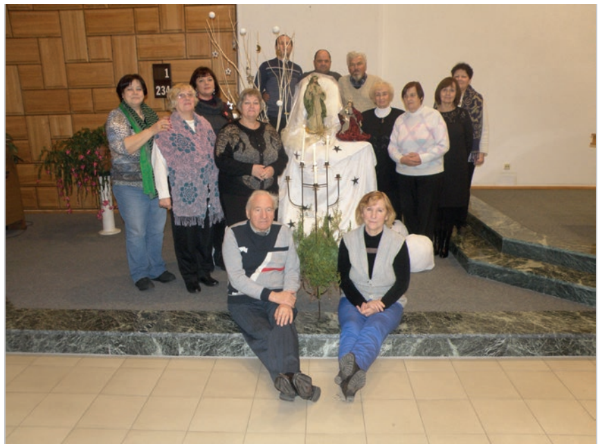
Lietuvos NAB sekmadienių mokyklėlių mokytojai prie prakartėlės Klaipėdos bažnyčioje