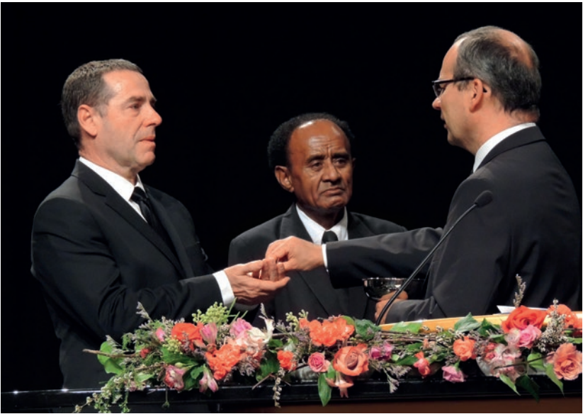
Գլխավոր առաքյալ Շնայդերը տոնում է Սուրբ Ընթրիքը ննջեցյալների համար

Այսօր մենք բժշկական լավ ծառայություն ունենք, ստիպված չենք շատ մտահոգվելու և ապագայի համար վախենալու: Մենք կյանքի հետություն ունենք, շատ խնդիրների համար լուծումներ կան: Այստեղ, երկրում խաղաղություն է տիրում և կարելի է ապագան կառուցել: Մենք ստիպված չենք այլևս անդրշիրիմյան լավ կյանք հուսալ: Կարող են այստեղ, երկրի վրա իրենց երջանկությունը իրականացնել, եթե ճիշտ գործեն: Այդտեղ չպետք է այլևս անդրշիրիմյան աշխարհի լավի համար երազել: Աստծո հետ միասնության կարոտը, Աստծո թագավորության սպասումը այլևս այդտեղ ոչ մի դեր չի խաղում: Շատ մարդիկ այլևս դրանով չեն հետաքրքրվում: