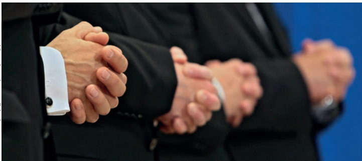
Լուսավորող՝ Մարտին Ֆելյե

Բոլոր մարդկանց հետ ջանացեք ապրել խաղաղությամբ. այսպես է ասվում եբրայեցիներին գրված նամակում / Եբրայեցիներին 12,14/: Մի շատ կարևոր կոչ. թույլ տալ տարածվելու մերձավորի հանդեպ սերը: Այս առումով մերձավորը նա է, ում Աստված մեր կողքին է դրել: Խաղաղության պատրաստները փառաբանվելու են - մենք պատրաստ ենք խաղաղության: