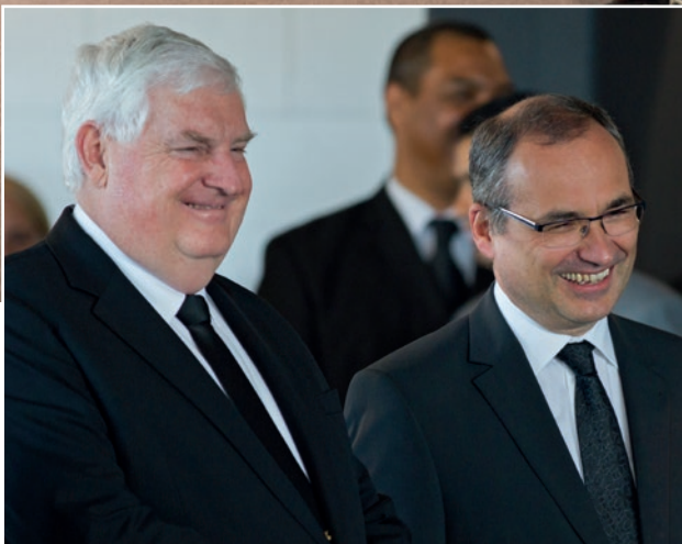
Առկլանդում տեղի ունեցած ժամերգությանը ներկա էին 900 մասնակիցներ, իսկ 1100-ը միացել էին հեռարձակմամբ՝ Հարավային Իսլանդիայում, Ավստրալիայում, Ֆիջի կղզիներում և Պապուա-Նորգվինեայում:

Սիրելի եղբայրներ և քույրեր, ես առաջին անգամ եմ այստեղ՝ Նոր Զելանդիայում: Շրջանային առաքյալից և եղբայրներից ես լսեցի, որ Նոր Զելանդիան հրաշալի երկիր է: Ես ձեր երկրից դեռ ոչինչ չեմ տեսել, բայց հավատում եմ այն ամենին, ինչ ինձ ասել են: Ես նաև լսել եմ, որ երկիրն ունի հրաշալի համայնքներ և հավատացյալ եղբայրներ ու քույրեր: Դրան ևս հավատում եմ, իսկ այսօր կարող եմ դա տեսնել և համոզվել: