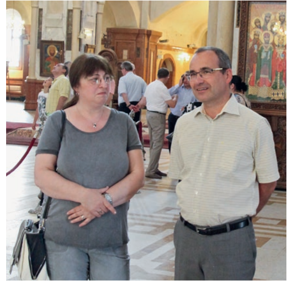
Շաբաթ օրը հավատքի եղբայրներն ու քույրերը գլխավոր առաքյալին ցույց տվեցին մայրաքաղաք Թբիլիսիին: 4,5 միլիոն բնակչություն ունեցող երկրում ինը համայնքների 1103 քրիստոնյաները փոքր թիվ են կազմում: