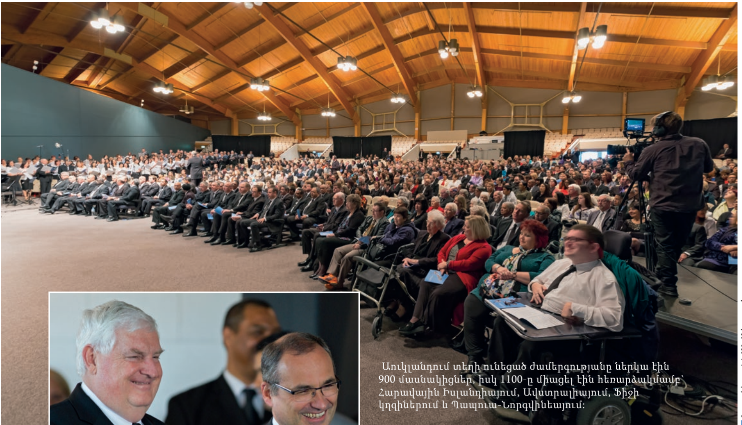
Լուսակալը՝ ՆԱԵ Ավարակալիա