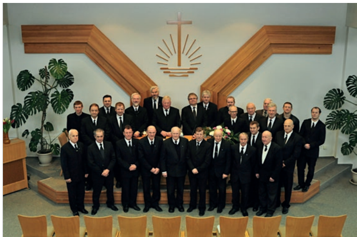
Lietuvos NAB tarnybos broliai Kaune