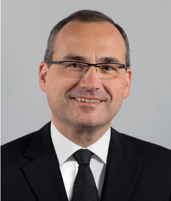
პირველმოციქული ჟან-ლუკ შნაიდერი

1980 წლის 10 იანვარს ის დიაკვნის თანაშემწედ აკურთხეს, 1985 წლის 24 ნოემბერს - მღვდლად, 1989 წლის 17 სექტემბერს - მახარებლად, 1993 წლის 1 იანვარს - მწყემსად, ხოლო 1993 წლის 14 ნოემბერს - სამხ. უზუცესად. ის იყო ჰოენჰაიმის (ელზასი) თემის წინამძღვარი და ახალგაზრდების ხელმძღვანელი. 2003 წლის 22 ივნისს პირველმოციქულმა ფერმა მას მოციქულის სასულიერო წოდება მიანიჭა და სამხ. მოციქულის თანაშემწეობა დაავალა.